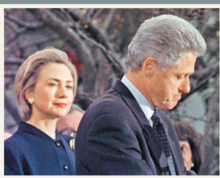
當年克林頓性醜聞曝光，令希拉里獲得美國人同情。資料圖片

克林頓總統圖書館前日公開美國前總統克林頓在任期間最後一批機密檔案，其中與他有染的前白宮實習生萊溫斯基調職內情成為焦點。當時白宮內部認為，萊溫斯基過於迷戀克林頓，決定把她調到國防部，不料反而掀起連場風波。檔案又顯示，白宮做足功課應付傳媒對性醜聞的提問，連關於治陽痿藥威而鋼(俗稱「偉哥」)的回答也準備好。