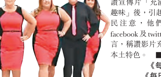
旅行社職員「V」字排開，氣勢十足。

不過，短片雖奇怪，卻成功引起迴響。愛爾蘭著名電視喜劇導演萊因漢在微薄twitter大讚宣傳片「充滿童真趣味」後，引起更多網民注意，他們紛紛於facebook及twitter轉載留言，稱讚影片充滿歡樂及本土特色。