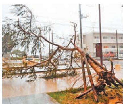
狂風暴雨下，樹木連根拔起。

陸九州，後日吹向本州。日本各航空公司昨日取消所有來往沖繩的航班，日本航空和全日空分別取消200多班及100多班航班。3萬多名乘客受影響。