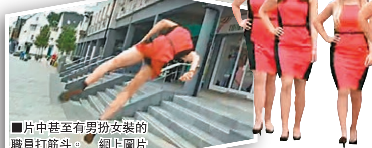
片中甚至有男扮女裝的職員打筋斗。