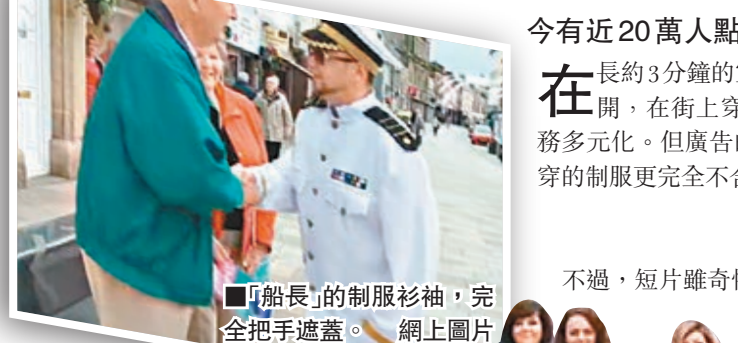
「船長」的制服衫袖，完全把手遮蓋。

分享網站YouTube上載最新宣傳短片，片內的舞蹈過氣，特技效果連業餘水平也比不上，演員的服飾更衣不稱身，但正因為騎呢，竟意外地在網絡爆紅，上載至今有近20萬人點擊，成功打響名堂，令營業額急升。