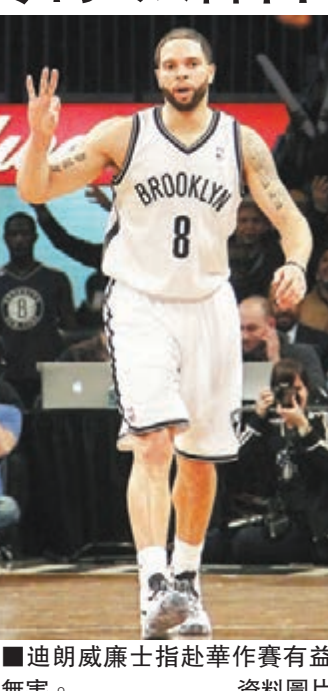
迪朗威廉士指赴華作賽有益無害。

網隊將在美國當地時間周三啟程飛往中國,這次中國之行共有北京和上海2場比賽,上海賽時間為本月12日,北京賽則是15日。首次帶隊的新任主帥賀連斯表示:「NBA就是個充滿太多干擾的聯盟,必須有足夠的意志力才能應付這一切。不僅經歷這樣的長途旅程,凌晨2時才能到達,還得堅持早上醒來,繼續訓練,這些都是聯盟的一部分。我覺得我們去中國是件好事,現在我們被選為聯盟大使,隨着聯盟的全球化發展,這是個非常重要的角色。」