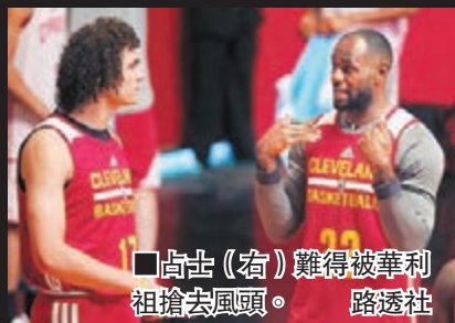
占士(右)難得被華利祖搶去風頭。