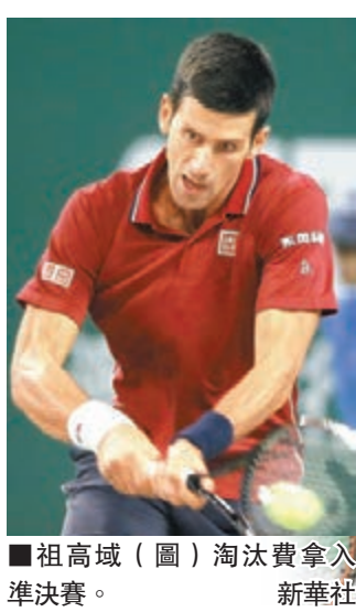
祖高域(圖)淘汰費拿入準決賽。