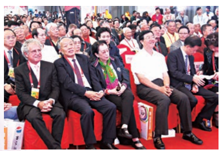
■開幕式上，前外交部部長李肇星（前排左二）等嘉賓到場致賀。

開幕式上，132名獲獎藝術家從頒獎嘉賓手中接過了獲獎證書和獎金。據了解，首屆南京國際美術展徹底打破了美展征選作品的慣例，在全球範圍內海選參展作品。短短幾個月，共有20多個國家和地區的藝術家送來了兩萬多幅參選作品，最終，評審委員會從中評選出了132幅獲獎作品，其中金獎作品8件，銀獎作品25件，銅獎作品99件。