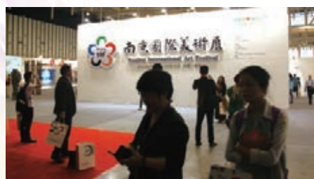
■「全球徵集作品展」和「資深藝術家特邀展」令觀展者流連忘返。

本屆美展創造了設立重獎全球海選這樣的作品徵集模式，吸引了海內外眾多藝術家攜帶作品前來參展。此外，組委會還邀請了眾多知名藝術界攜帶其代表作品參展。10月8日，以獲