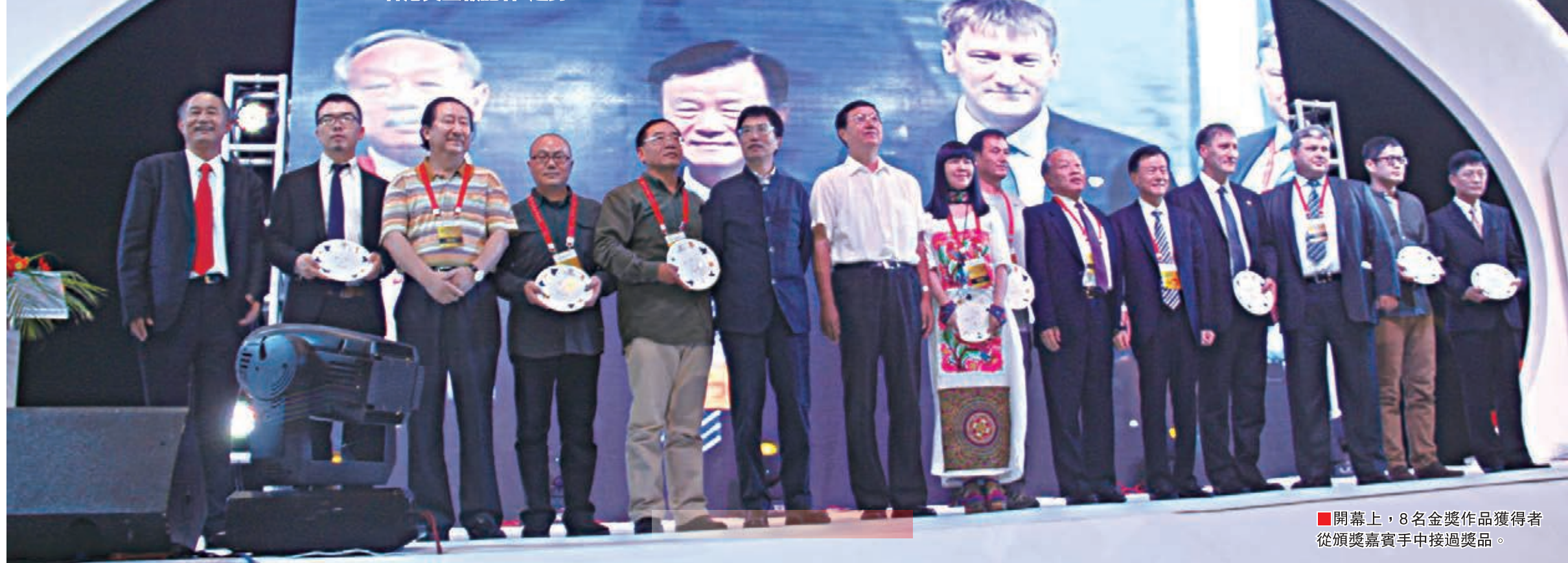
■開幕上，8名金獎作品獲得者從頒獎嘉賓手中接過獎品。