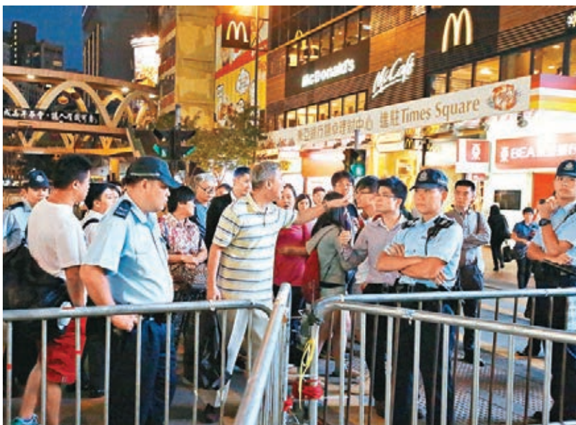
「佔領」集會已干擾市民生活，最受苦的不是大商家，反而是升斗市民。圖為銅鑼灣因堵路引起爭執。