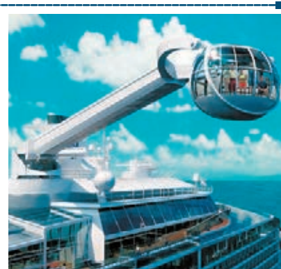
■「海洋量子」號設有觀光玻璃艙。網上圖片

皇家加勒比郵輪公司旗下的全球第三大郵輪「海洋量子」號(Quantum of the Seas)，將於下月啟航，由英國南安普敦前往美國紐約，明春會駛至上海的母港。船艙頂層設有以巨型吊臂控制的觀光玻璃艙，可將乘客升至300呎高空俯瞰景色。船上還有機械人酒保、碰碰車等設施，愛乘搭郵輪的人將可獲得新體驗。「海洋量子」號被譽為最高科技郵輪，它以電子腕帶作門匙，而無窗戶的房間會有虛擬露台。船上娛樂設施豐富，包括攀石牆、溜冰場、跳傘及衝浪模擬裝置等，另設有現場表演音樂劇《Mamma Mia》等節目。「海洋量子」號共有18層，足以容納4,180名乘客，排水量近17萬噸。郵輪將於明年進駐亞洲，以上海為母港，展開連串亞洲之旅，期望開拓亞洲尤其中國的旅遊市場。■《每日郵報》