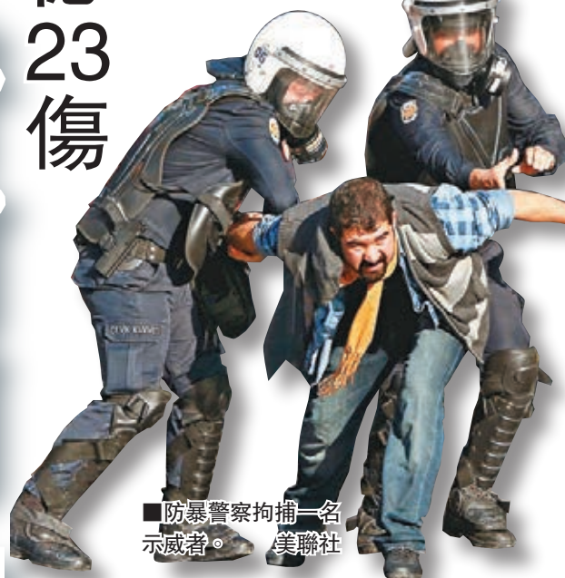
■防暴警察拘捕一名示威者。

德國漢堡約400名庫族前日示威，其後在一間清真寺外聚集，與約400名薩拉菲派穆斯林爆發衝突。警方指，涉事者大部分手持鐵棒、木棒、開山刀，並互相擲石及玻璃樽。防暴警察使用胡椒噴霧、水炮及警棍驅散，共14人受傷，其中4人傷勢嚴重，警方拘捕22人。同日在下薩克森州策勒市，數百名情緒激