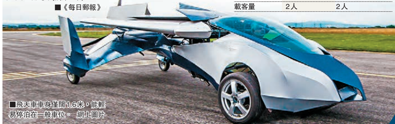
■飛天車車身僅闊1.6米，能輕易停泊在一般車位。