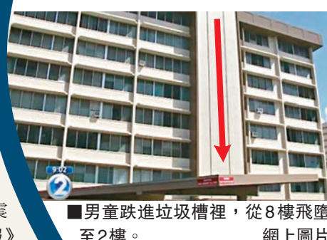
■男童跌進垃圾槽裡，從8樓飛墮至2樓。網上圖片

有人飲咖啡可提神，有人飲多少也不會感到分別，原來人體內有一種「咖啡因基因」，控制身體對咖啡因的反應。哈佛大學公共衛生學院分析了20多份、累計參與人數超過12萬的研究報告，發現人體內有4組基因與咖啡因直接產生反應，決定身體分解咖啡因或加強其效果的能力，或有助醫生建議病人攝取咖啡因的份量。研究結果前日於《分子精神醫學》期刊發表。研究採用的數據包括受訪者每日咖啡飲用量及脫氧核糖核酸(DNA)分析，探討飲用咖啡多寡對DNA造成的微小分別。研究員發現飲用咖啡後，DNA會出現8組變化，其中2組是已知的，其餘6組是新發現，當中4組直接與咖啡因有關，餘下2組則與膽固醇水平及血糖有關，令研究員震驚。■《每日郵報》