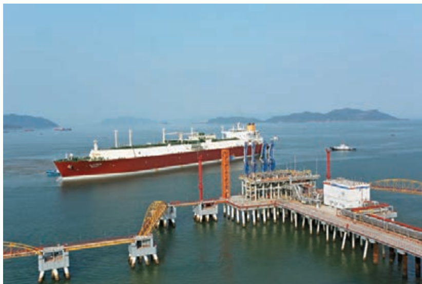
■世界超大型LNG運輸船型——Q-Max船靠泊珠海LNG碼頭。

LNG運輸船型中最大的Q-Max船型，它的設計承載能力是26.7萬方，船長345米，船寬54米，比中國「遼寧」號航空母艦還要長40.5米。「阿薩利」此次航行的起點是目前世界最大的LNG出口國卡塔爾，終點是珠海港珠海LNG碼頭。 接卸Q-Max型船舶顯實力 此次成功接卸Q-Max型船舶，既檢驗了珠海港航道能力和碼頭實際靠泊技術條件，更為以後靠泊超大型LNG運輸船積累了寶貴經驗。