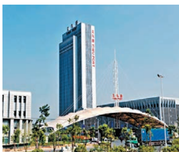
■義烏港實際監管出口集裝箱每天保持在3,000標箱左右。

香港文匯報訊(記者白林森 溫州報道) 國際經濟低迷並未阻擋世界超市浙江義烏小商品出口持續增長的步伐。近日，浙江義烏市場監督管理局披露的數據顯示，前三季度，義烏市集貿市場總成交額達715.14億元(人民幣，下同)，其中中國小商品城成交額576.74億元，為歷史同期最好成績。