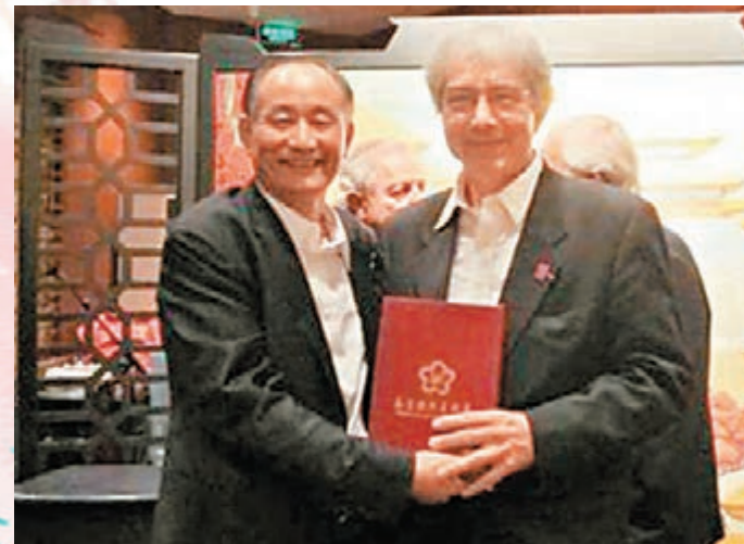
■法國美協主席雷米·艾融接過聘書，擔任南京國際美術展組委會副主席。

此外，本屆南京國際美術展面向全球徵選參展作品，不僅體現了寬闊的國際視野，而且為全世界藝術界的融合提供了一個很好的平台。據了解，本屆美展的全球徵集作品展覽將展出132件全球徵選而來的高水平獲獎作品和800件提名作品，這些作品是從20個國家和地區20087件應徵作品中嚴格遴選出來的，132件獲獎作品中，來自國外的就有16件。