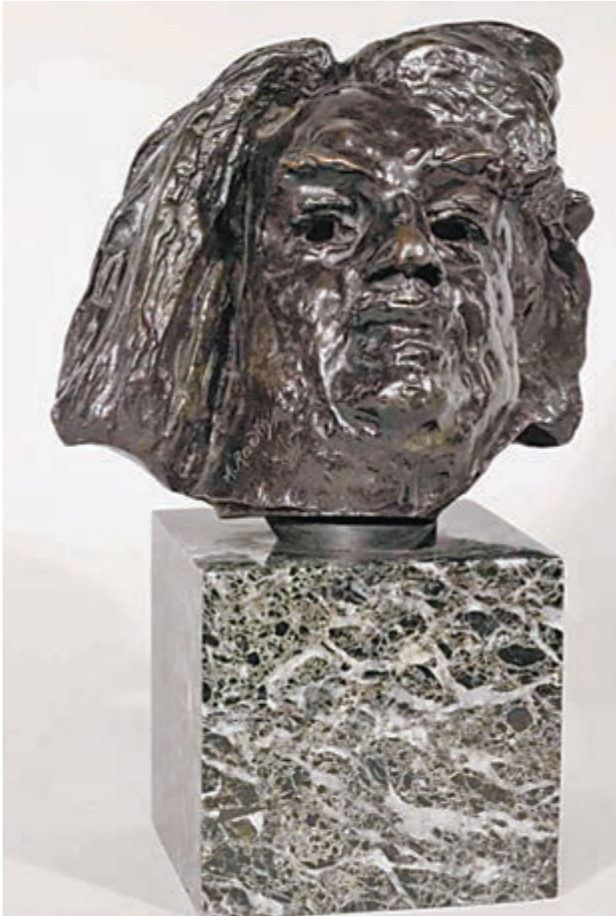
■世界藝術大師作品參展作品，畢加索雕塑作品《男人頭像》。