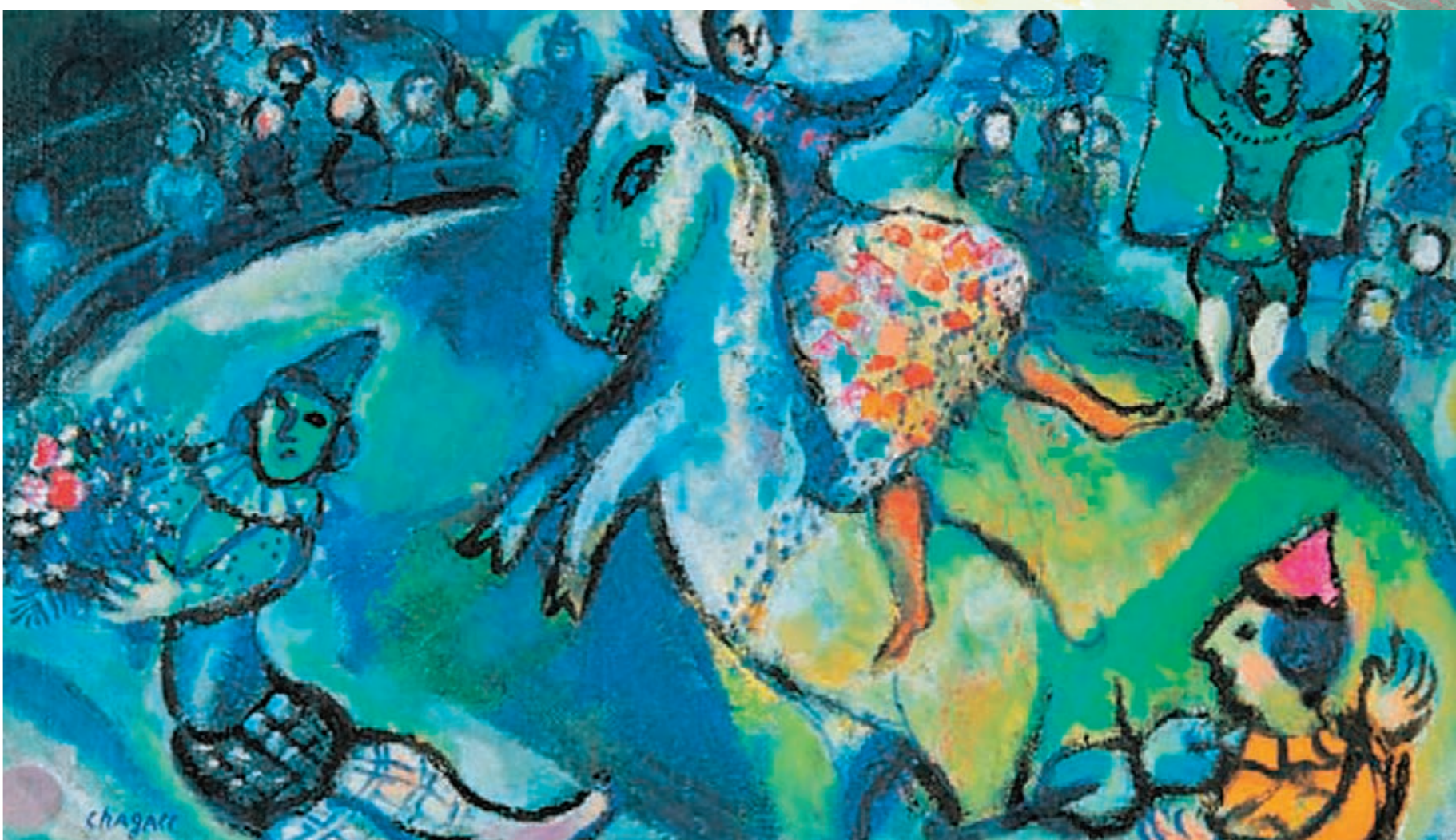
■世界藝術大師作品參展作品，夏加爾繪畫作品《馬戲團場景》。