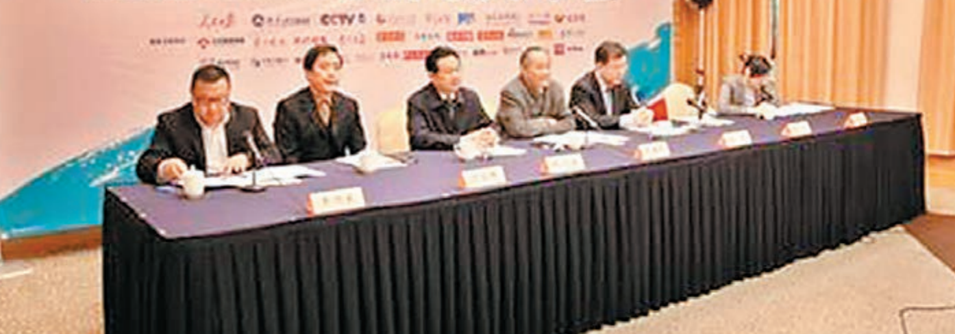
■南京國際美術展全球徵選作品，徹底顛覆了以往美展的作品徵選定律，引發全球藝術節高度關注。

除了藝術家培養計劃，以南京國際美術展為平台的中國最大的在線永久保真藝術品交易網站「中藝易購500」很快也將上線，這在線上交易平台不僅擁有極為豐富的藝術品資源，而且打造了平價交易、競價交易、在線拍賣、線下拍賣、私人洽購、私人訂製等6種交易模式，藝術品500元起售。「中藝易購500」的上线將打破藝術品交易的高價時代，為全民消費藝術品的時代、壯大中國文化產業打下堅實的基礎。