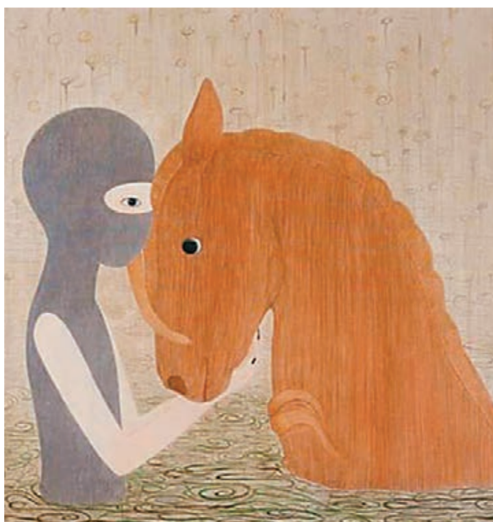
■參加特邀展的著名畫家俞潔的代表作《洗馬圖》。

任何美展，最終都是要靠參展作品的水平來說話，首屆南京國際美術展不僅將展出全球徵選而來的高水平獲獎作品，而且在世界藝術大師作品展和資深藝術家特選展中，更是雲集了古今中外的殿堂級名作，將為觀展者獻上一場饕餮盛宴。