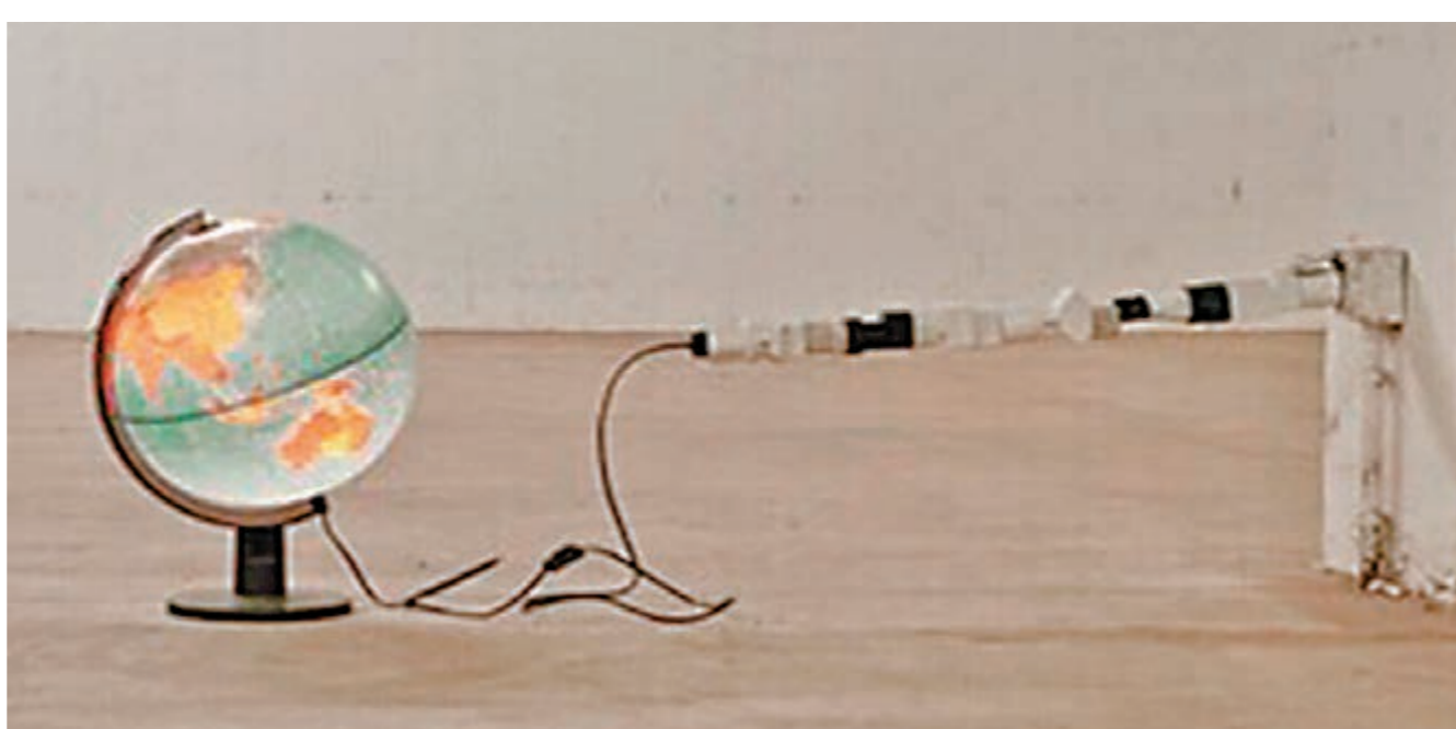
■參加特邀展的法國鬼才藝術家科林·古伊梅的作品《環遊地球》。

除了殿堂級的世界藝術大師作品展，本屆美展的資深藝術家特選展也雲集中學多當代藝術大師的代表性作品。西班牙著名抽象派畫家瑪塔·馬雷；意大利著名畫家、雕塑家艾多·雅尼奇；意大利藝術大師保羅·勞迪薩；香港著名畫家林明琛；法國鬼才藝術家科林·古伊梅；著名雕塑家弗朗切斯科·洛維耶羅；荷蘭空間藝術家雷納爾德·奧施赫恩；亞洲藝術家聯盟中國委員會主席左正亮；南京藝術學院美術學院院長張友憲；著名當代水墨畫家何瑞明；著名畫家俞潔等海內外大師都將攜各自的代表作參展。