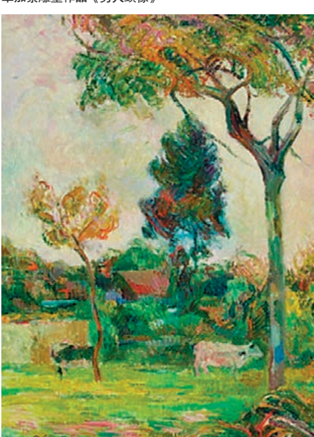
■世界藝術大師作品參展作品，高更繪畫作品《樹下的兩頭牛》。