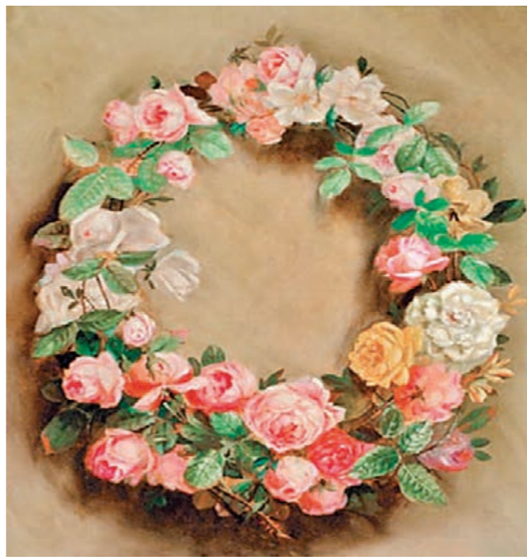
雷諾阿繪畫作品《玫瑰花》