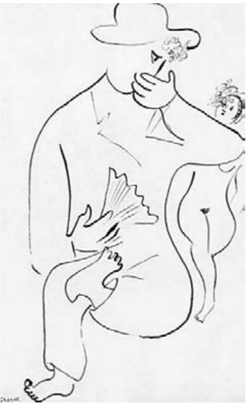
馬克·夏加爾繪畫作品《拿扇子的男青年》