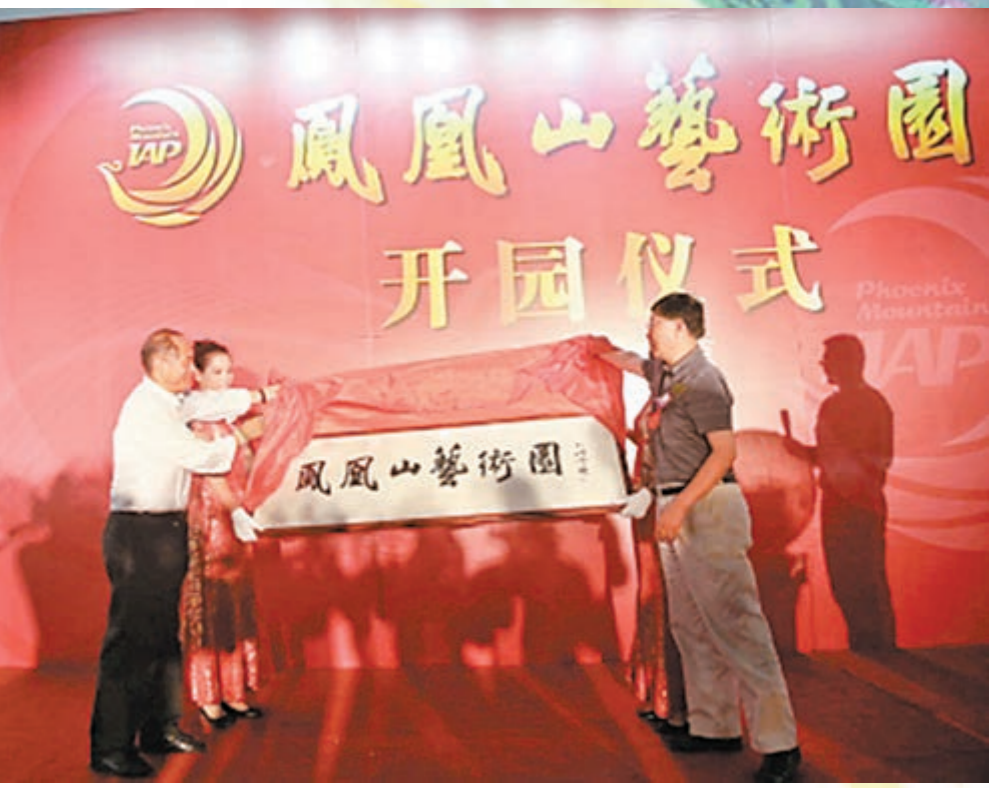
鳳凰山藝術園將成為美展的配套孵化器