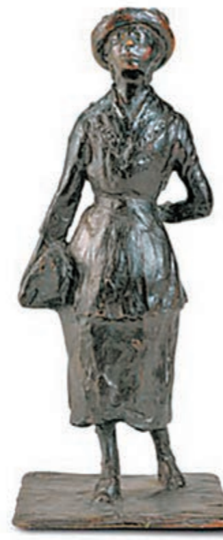
埃德加·德加雕塑作品《女士》