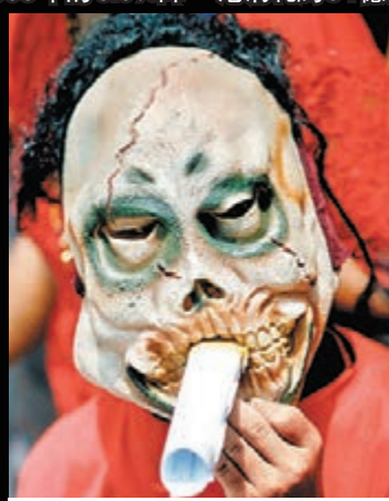
煙草每年造成全球約600萬人死亡。 資料圖片

另一個影響是政府稅收，由於煙民長期投訴私煙市場，有組織推算，本港因而損失的煙草稅收高達32億港元。因此，政府推廣控煙政策時，也需提醒私煙交易屬違法活動。根據《應課稅品條例》，在私煙交易中，買賣雙方均屬違法，除罰款外，亦可能涉及牢獄之災。