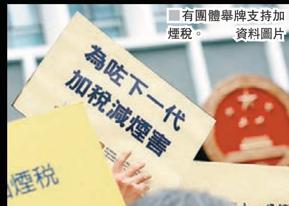
有團體舉牌支持加稅。 資料圖片