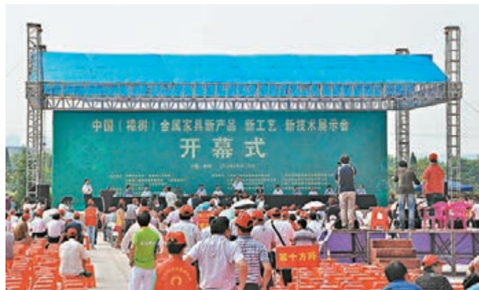
■圖為中國金屬傢具產業發展論壇開幕式現場。

香港文匯報訊(實習記者 牛琰 樟樹報道)中國金屬傢具產業發展論壇暨新產品、新工藝、新技術展示會於日前在中國首個「中國金屬傢具產業基地」江西省樟樹市舉行。來自內地金屬傢具行業的