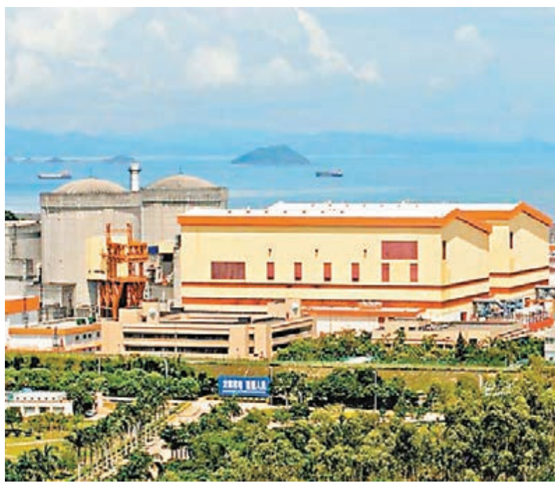
■圖為中廣核旗下的大亞灣核電站。

為進一步增強市場化競爭力,中廣核正積極推行市場化改革,在資本市場進行戰略佈局。除核燃料業務已通過中廣核礦業(1164)實現上市外,中廣核核電資產也已通過中廣核電力向香港聯交所提交了上市申請文件。同時,作為中廣核開發及運營非核清潔及可再生能源發電項