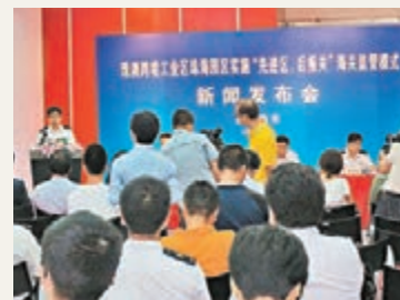
■全國首個跨境工業區實施「先進區、後報關」海關監管模式發佈會現場。

香港文匯報訊(記者 李芳 珠海報道)拱北海關在珠澳跨境工業區珠海園區日前宣佈在珠海園區全面實施「先進區、後報關」海關監管模式,標誌著拱北海關複製推廣上海自貿區14項海關監管創新制度中的第一項在珠澳跨境工業區珠海園區正式落地。