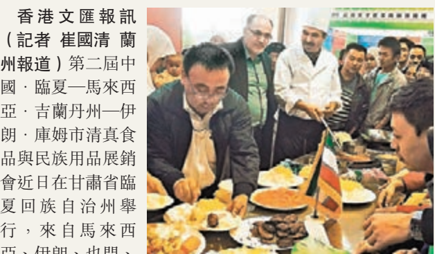
■來自伊朗的清真美食受到賓客青睞。

香港文匯報訊(記者 崔國清 蘭州報道)第二屆中國·臨夏—馬來西亞·吉蘭丹州—伊朗·庫姆市清真食品與民族用品展銷會近日在甘肅省臨夏回族自治州舉行,來自馬來西亞、伊朗、也門、土耳其等5個國家和廣東、陝西等內地多個省市區的231家企業參會參展。此次節旨在打造甘肅清真產業發展合作平台,建設伊斯蘭經濟貿易大通道,推進與會各方互利共贏。