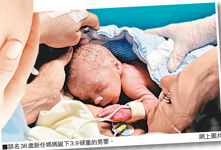
該名36歲新任媽媽誕下3.9磅重的男嬰。

需長時間手術 風險大 全球很多婦女因遺傳病而天生沒子宮，又或患癌症而失去子宮，今次成功個案為她們帶來新希望。不過有專家指出，這種方法牽涉到長時間的手術過程，而且充滿風險，認為子宮移植不會成為主流治療法，相信只會在別無他法下用作最後手段。