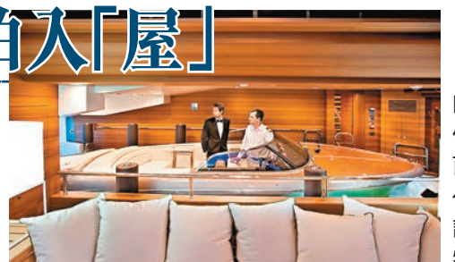
快艇的停泊位前面就是梳化，設計認真獨特。

意大利遊艇生產商 Ferretti 把奢華提升到更高層次，推出一款長196呎的 Jade 超級遊艇，船艙採用頂級物料，包括紫檀木及胡桃木等，最特別之處，是船內竟設有可停泊一艘26呎長快艇的泊位，是全球第一艘擁有此設計的私人遊艇，仿如把豪宅搬到水中。遊艇每艘售價約6,000萬美元(約4.7億港元)。 ■綜合報道