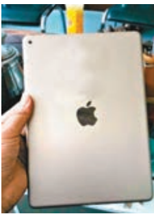
網上流傳新 iPad 的金色機背。

據科技網站報道，蘋果公司計劃本月16日於總部舉行發布會，預料發布搭載指紋辨識系統的新版平板電腦 iPad，超高解像度的 OS X Yosemite，流動支付功能 Apple Pay 亦可能登場。蘋果希望推銷 iPad，以減少依賴佔營業額一半的 iPhone。據悉新 iPad 將搭載 Touch ID 指紋辨識功能，處理器升級為 A8，與新 iPhone 齊齊，更可能推出金色版，至於屏幕則維持在 9.7 及 7.9 吋。