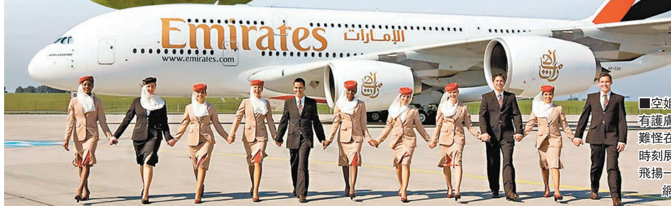
空姐空少各有護膚秘技，難怪在飛機上時刻展現神采飛揚一面。

頭髮忌用定型產品 髮型方面，空姐絕不建議使用定型產品，而是在髮尾塗上髮尾油或護髮精華，梳頭最好用木梳，防止靜電令秀髮飛散，有時她們會用少量潤手霜或唇彩塗抹頭髮，使之貼服順滑。空中少爺也有獨門秘方，他們剃鬚時會選用剃鬚油，為肌膚補濕、預防敏感，亦會用剃鬚刷抹上剃鬚膏，當作天然去角質產品。 ■《每日郵報》