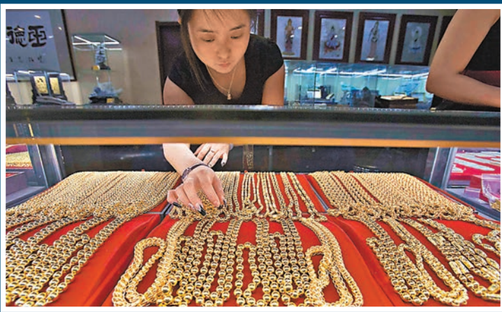
山西太原一金店店員正在整理黃金。