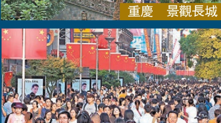
上海 南京路步行街