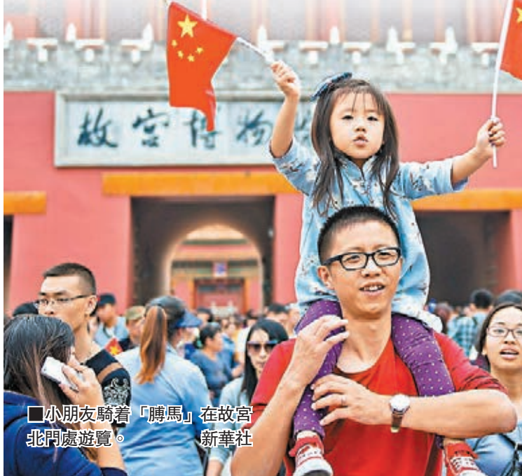
小朋友騎着「騰馬」在故宮北門處遊覽。