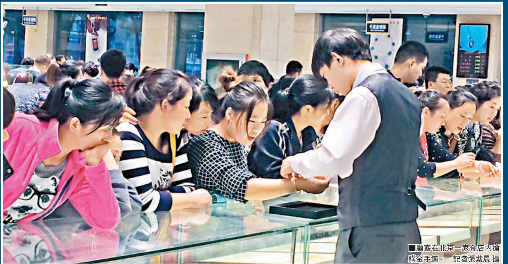
顧客在北京一家金店內搶購金手鐲。

香港文匯報訊（記者張紫晨北京報導）昨日是國慶黃金周的第四天，北京各大消費場所均迎來客流高峰。而在剛過去的周五，紐約黃金期貨收跌1.8%，報每盎司1,192.90美元，創下自2010年2月份以來最低收盤價。受此影響，國內金價也隨之「跳水」，又逢十一黃金周，大批市民蜂擁而至，北京各大金店昨日又迎來新一輪「搶金」狂潮。