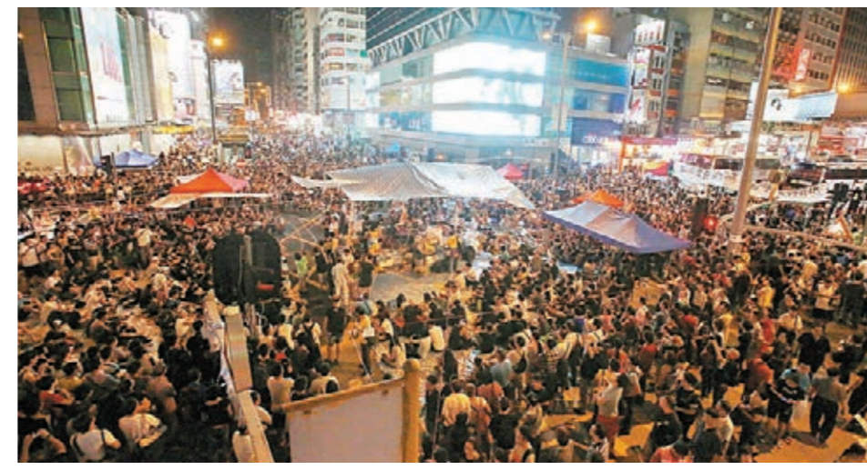
10月1日，「佔中」行動第四天晚上，旺角彌敦道人群聚集，場面幾近失控。