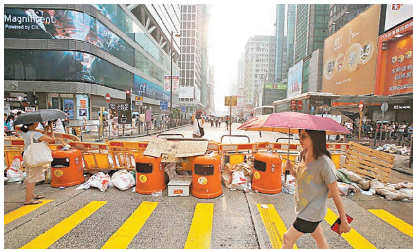
9月30日，「佔中」行動第三天，旺角平日繁忙路面因受阻而變得冷清。