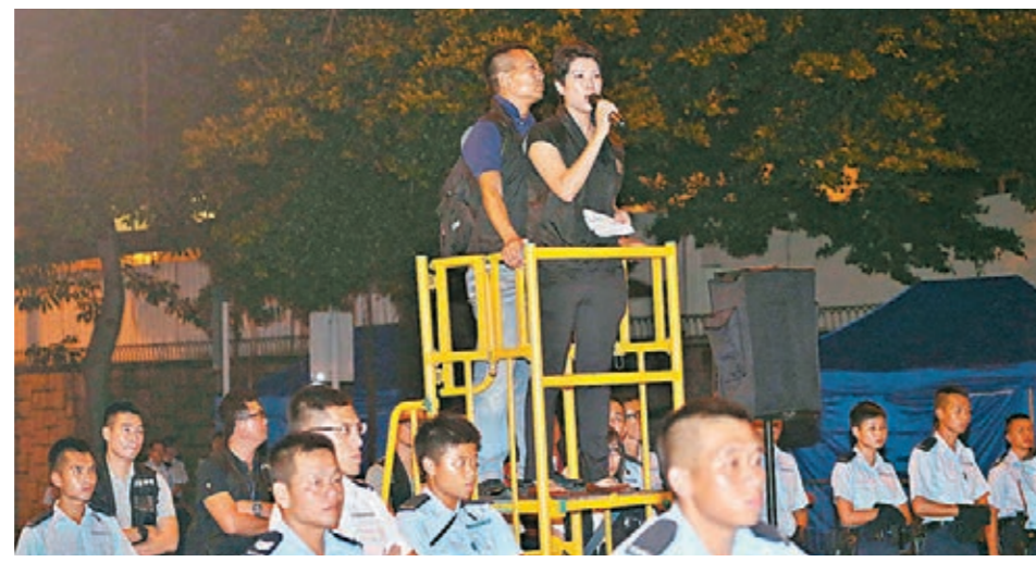
9月28日「佔中」行動第一天晚上，警方派出談判專家談話，勸喻示威者勿衝擊特首辦和警方防線，否則警方將會果斷執法。