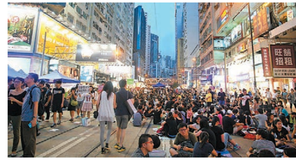
10月1日晚上，「佔中」行動人士於銅鑼灣購物區靜坐，影響區內店舖生意。