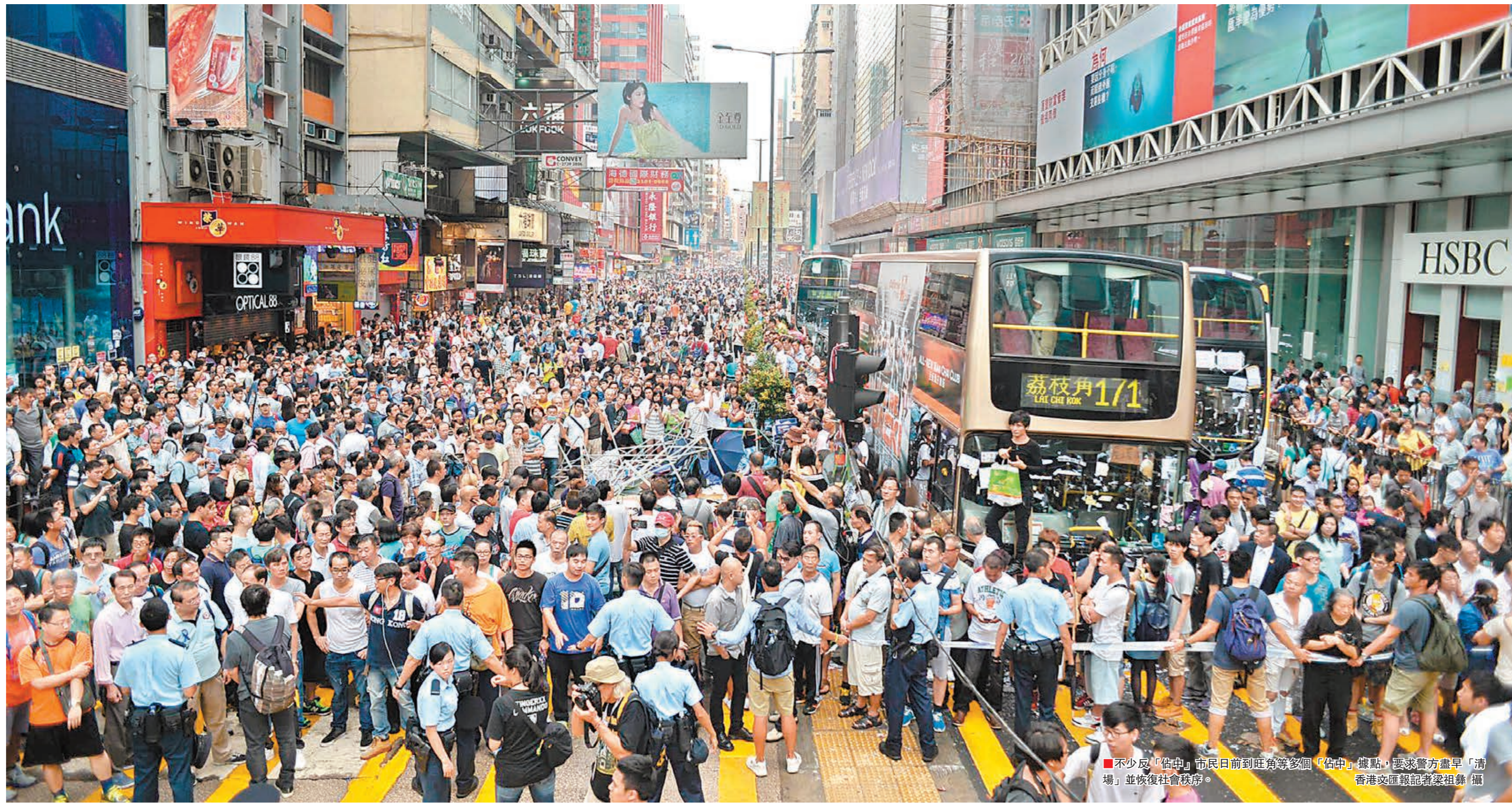
不少反「佔中」市民日前到旺角等各個「佔中」據點，要求警方盡早「清場」並恢復社會秩序。