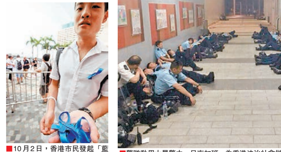
10月2日，香港市民發起「藍絲帶運動」反對「佔中」行動。