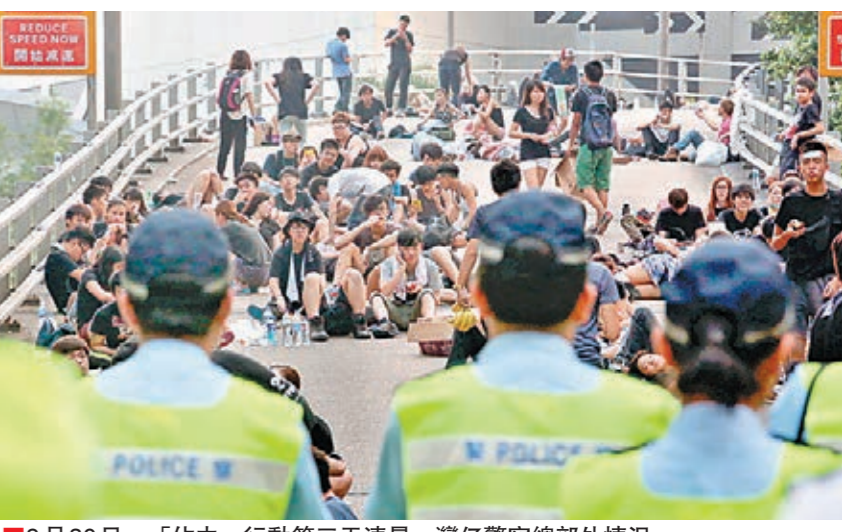
9月30日，「佔中」行動第三天清晨，灣仔警察總部外情況。