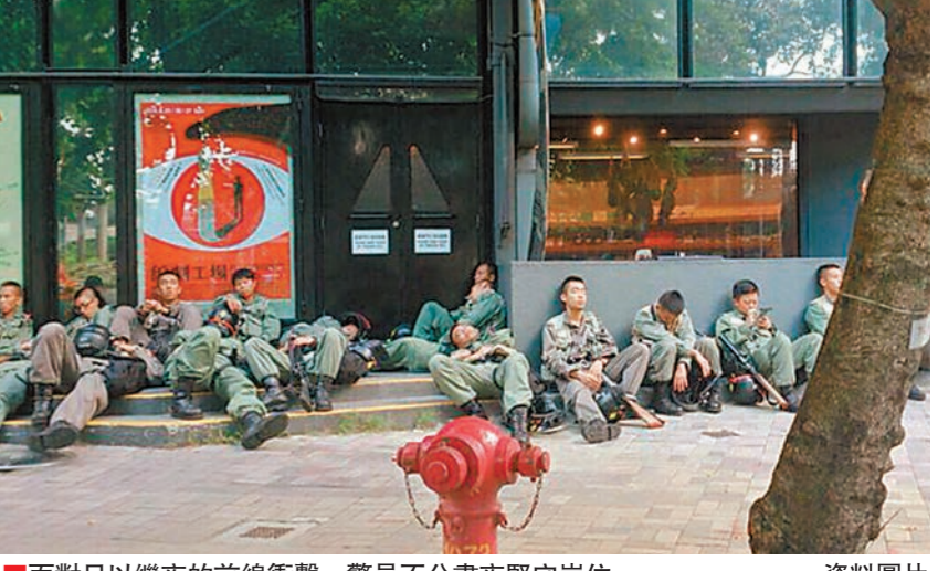
面對日以繼夜的前線衝擊，警員不分晝夜堅守崗位。資料圖片