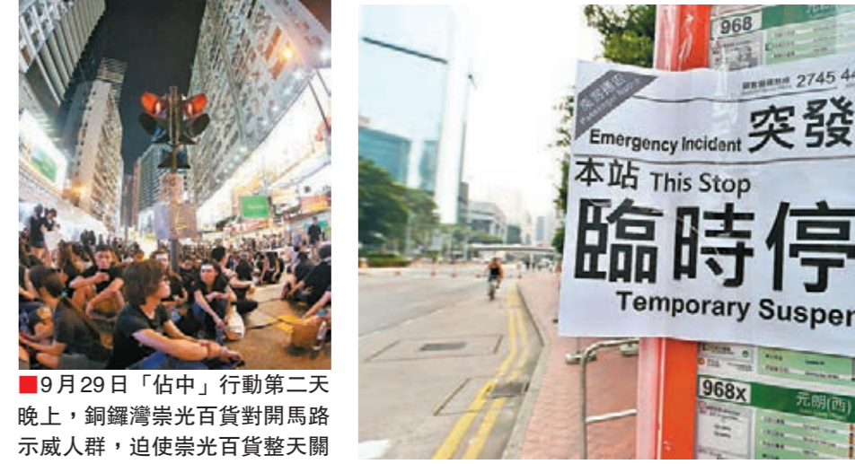
9月29日「佔中」行動第二天晚上，銅鑼灣崇光百貨對開馬路示威人群，迫使崇光百貨整天關門停業。