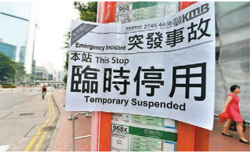
9月30日「佔中」行動第三天，因受其影響，超過40%巴士繼續暫停服務，亦有多條路線改道行駛，市民、遊客出行受到嚴重影響。