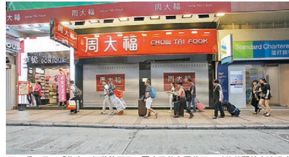
10月1日，「佔中」行動第四天，國慶日黃金周首日，以往熱鬧的沙田咀廣東道至旺角彌敦道，受影響嚴重。