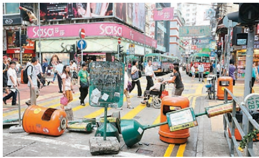
9月30日，「佔中」行動持續蔓延到九龍旺角，彌敦道及亞皆老街口聚集了大批抗議民眾，周禮巷道被垃圾桶與公車站牌阻擋，車輛必須繞道而行。