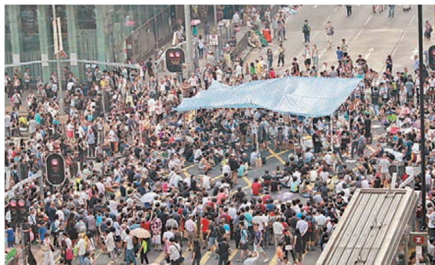
9月30日，「佔中」行動第3天，旺角彌敦道聚集人群，阻塞交通。