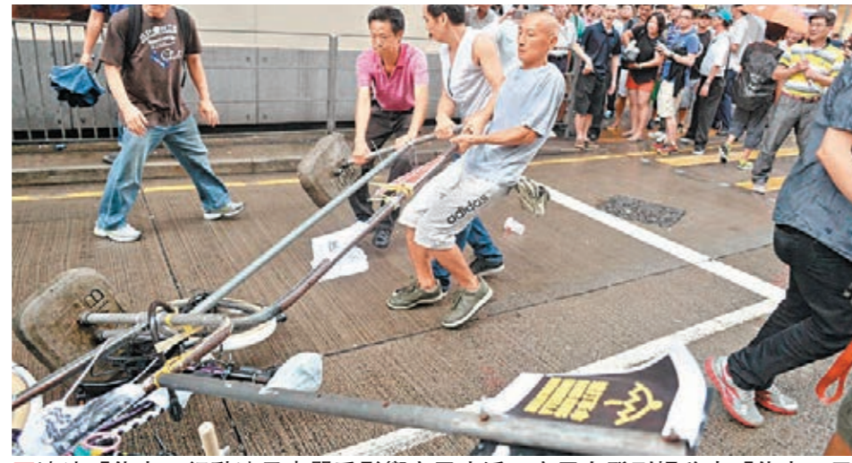
違法「佔中」行動連日來嚴重影響市民生活，市民自發到場移走「佔中」示威者的帳篷與路障。