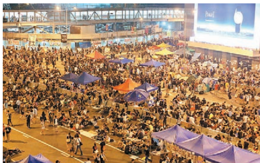
10月3日凌晨，在中環「佔中」行動人士不肯散去。