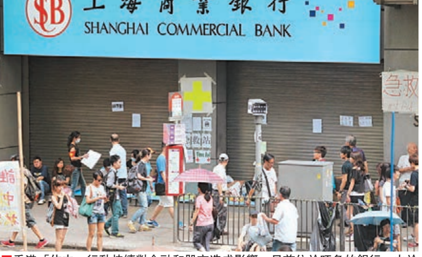
香港「佔中」行動持續對金融和股市造成影響，日前位於旺角的銀行，由於交通阻滯，無法正常運送鈔票及支票交收，區內的自動櫃員機也停止服務。