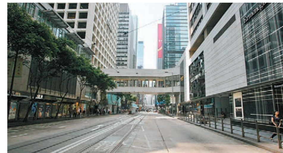
9月29日「佔中」行動第二天，中環街頭人煙稀少，經濟大受影響。