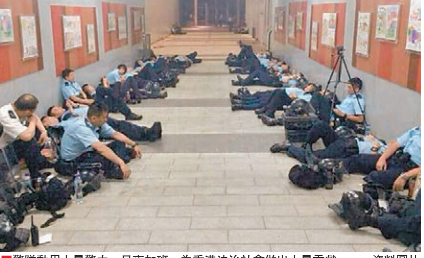
警隊動用大量警力，日夜加班，為香港法治社會做出大量貢獻。