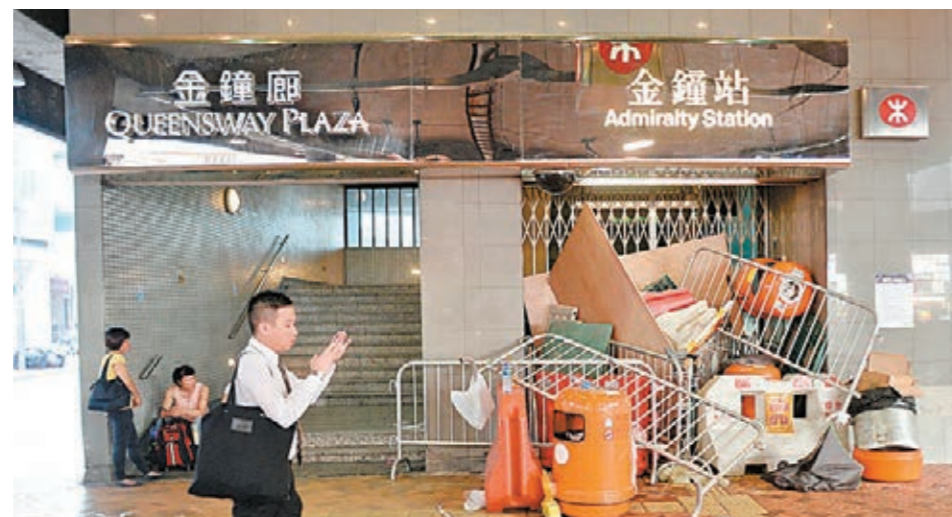
9月29日「佔中」行動第二天，金鐘地鐵站出口遭鐵馬及障礙物攔堵。