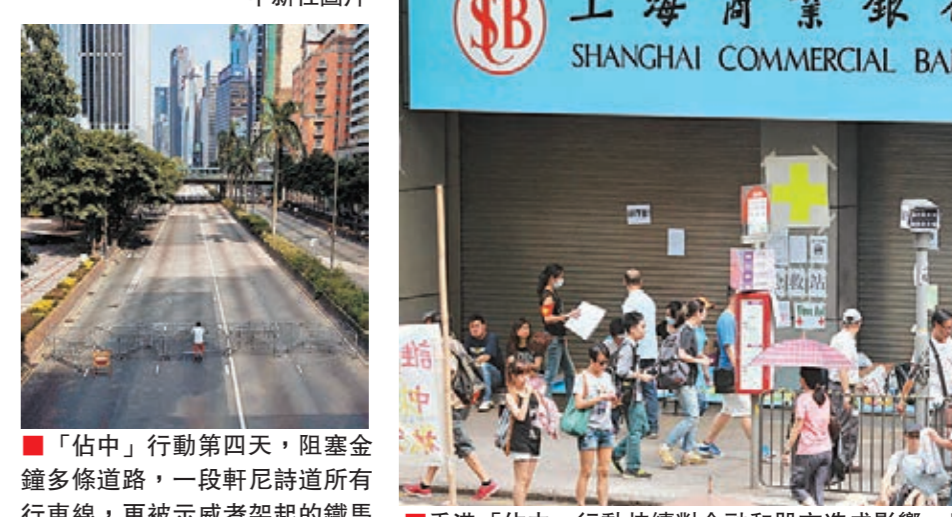
「佔中」行動第四天，阻礙金鐘多條道路，一段軒尼詩道所有行車線，更被示威者架起的鐵馬封鎖，影響緊急車輛通行。