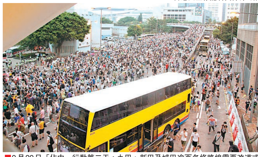
9月29日「佔中」行動第二天，九巴、新巴及城巴逾百多條路線需要改道或暫停服務，不少市民都批評「佔領」行動癱瘓交通，行程受阻。資料圖片