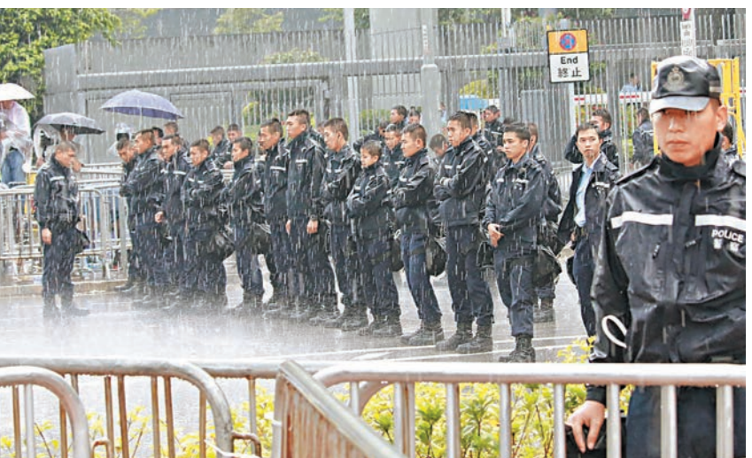
10月3日，警員在金鐘政總外面冒雨站崗。