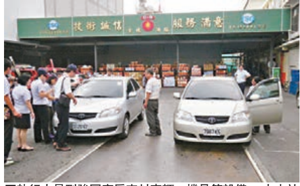
■執行人員到強冠廠房查封車輛、機具等設備。中央社