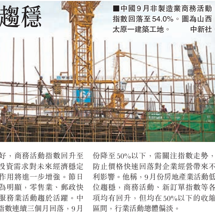
■中國9月非製造業商務活動指數回落至54.0%。圖為山西太原一建築工地。中新社

另據中新社報道，中國物流與採購聯合會副會長蔡進認為，9月份，中國非製造業市場活動整體趨穩。建築業