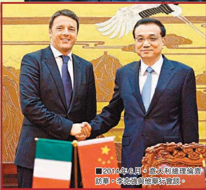
■2014年6月，意大利總理倫齊訪華，李克強與他舉行會談。

香港文匯報訊（記者張紫晨北京報道）中國國務院總理李克強將於10月9日至15日出訪歐洲，正式訪問德國、俄羅斯和意大利，15日造訪位於羅馬的聯合國糧農組織總部，16日至17日出席在米蘭舉行的第十屆亞歐首腦會議。據媒體報道，李克強訪問期間，中德有望在創新領域簽署一系列合作協議，中俄將簽署系列重要合同和協議，意國則期待中企擴大對意的投資。專家指，這種定期會晤的外交機制不僅深度促進中國「深耕歐洲」，同時也將進一步推動亞歐對話交融。