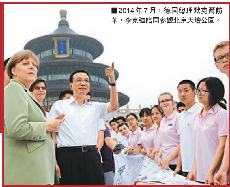
■2014年7月，德國總理默克爾訪華，李克強陪同參觀北京天壇公園。