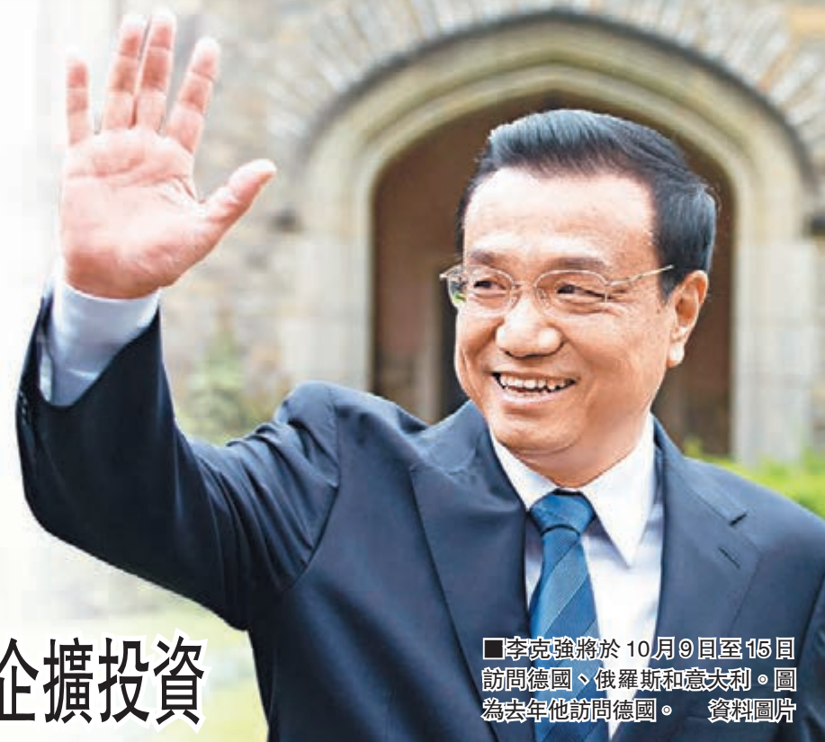
■李克強將於10月9日至15日訪問德國、俄羅斯和意大利。圖為去年他訪問德國。