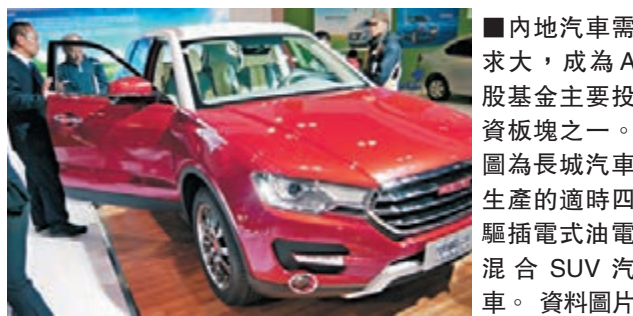
內地汽車需求大，成為A股基金主要投資板塊之一。圖為長城汽車生產的適時四驅插電式油電混合SUV汽車。資料圖片