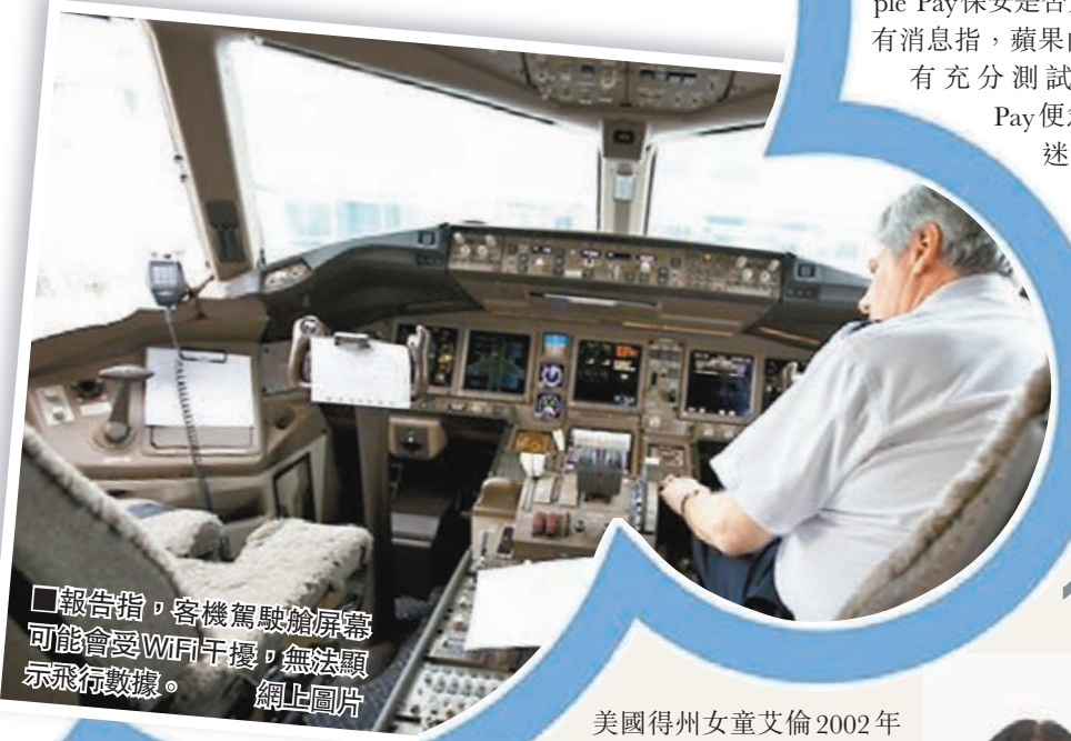
報告指，客機駕駛艙螢幕可能會受WiFi干擾，無法顯示飛行數據。