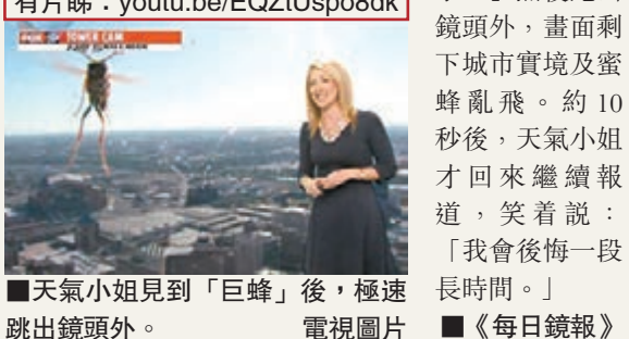
天氣小姐見到「巨蜂」後，極速跳出鏡頭外。

天氣小姐見到蜜蜂即大叫「天啊！牠又飛回來了！」然後跑出鏡頭外，畫面剩下城市實境及蜜蜂亂飛。約10秒後，天氣小姐才回來繼續報道，笑着說：「我會後悔一段長時間。」