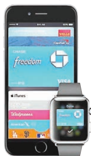
新iPhone及Apple Watch用家將可用Apple Pay付款。網上圖片

不過有專家憂慮Apple Pay保安是否充足，有消息指，蘋果內部未有充分測試Apple Pay便急於推出，並預料發布當日全美「果迷」將爭相試用，如有差錯恐釀成大混亂。