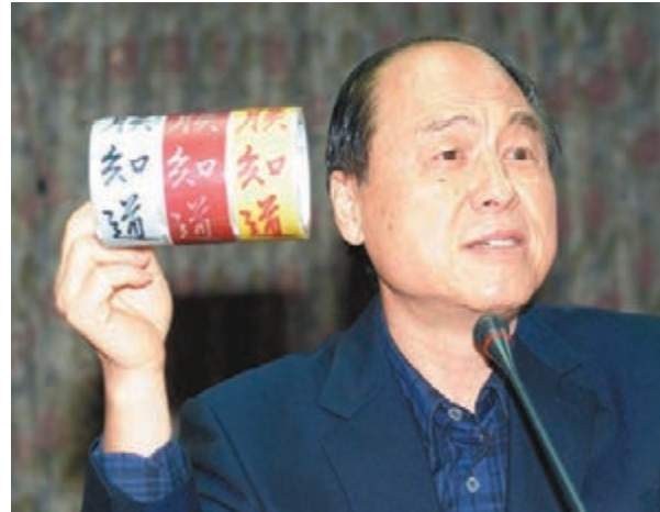
■台北故宮「朕知道了」紙膠帶仿冒品充斥市場，在台灣淘寶網也能買到「朕知道了」封箱膠帶。中央社

台北故宮統計，今年8月底前開發的文創商品約有2344種，營額總額約新台幣3億多元(約7637萬港元)，其中翠玉白菜系列文創商品最受歡迎，霸氣十足的「朕知道了」紙膠帶也很受青睞。然而，正版的「朕知道了」紙膠帶只有1.5公分寬的小卷，淘寶網上打着台北故宮文創品販賣的仿冒膠帶甚至有寬達4.8公分的大卷，令人哭笑不得。