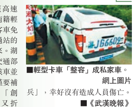
■輕型卡車「整容」成私家車。網上圖片

前天上午10點，在二廣高速東岳廟收費站，一改裝湖南籍輕型卡車，趁着節假日小型客車免費，想要蒙混過關，就在過站的一瞬間站口的欄杆打了下來。湖北省高警公安大隊民警和交通部門檢查該車行駛證發現，該車並不在免費車輛範圍內，不僅要補交費用，還使愛車遭受「創傷」，真是「賠了夫人又折