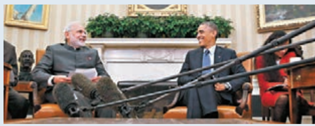
■奧巴馬日前與訪美的印度總理莫迪舉行會談。

在共同聲明中，美印特別提及南海，並呼籲各方避免使用或威脅使用武力。維賈伊拉克希米認為這是在暗示中國，同時也是印度對中國傳遞訊號，在發展經濟與確保能源安全上，印度將會保衛自己的海上利益。