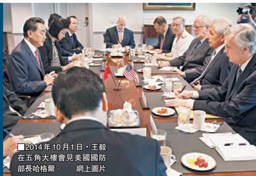
■2014年10月1日，王毅在五角大樓會見美國國防部長哈格爾。

香港文匯報訊 王毅當地時間10月1日在五角大樓會見美國國防部長哈格爾。王毅表示，雙方應共同努力，爭取使兩軍關係成為雙邊關係的穩定器。