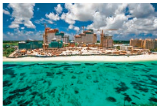
■中國建築從中國帶去了約4,000名工人建設Baha Mar項目。

香港文匯報訊 據《華爾街日報》報道，中國建築股份有限公司（簡稱：中國建築）開發的中國最大海外商用地產項目——Baha Mar度假村和娛樂場遇阻，出現建設延誤和勞資衝突。