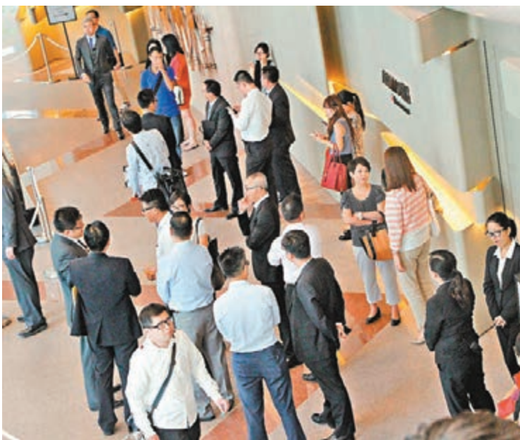
太古發展的半山豪盤瀚然啓動第二輪開售。

另一邊廂,由恒地、新世界及培新合作發展的烏溪沙迎海、星灣御,較銷攻勢升溫。發展商昨天為項目位處的馬鞍山區進行路演活動,恒地營業(一)部