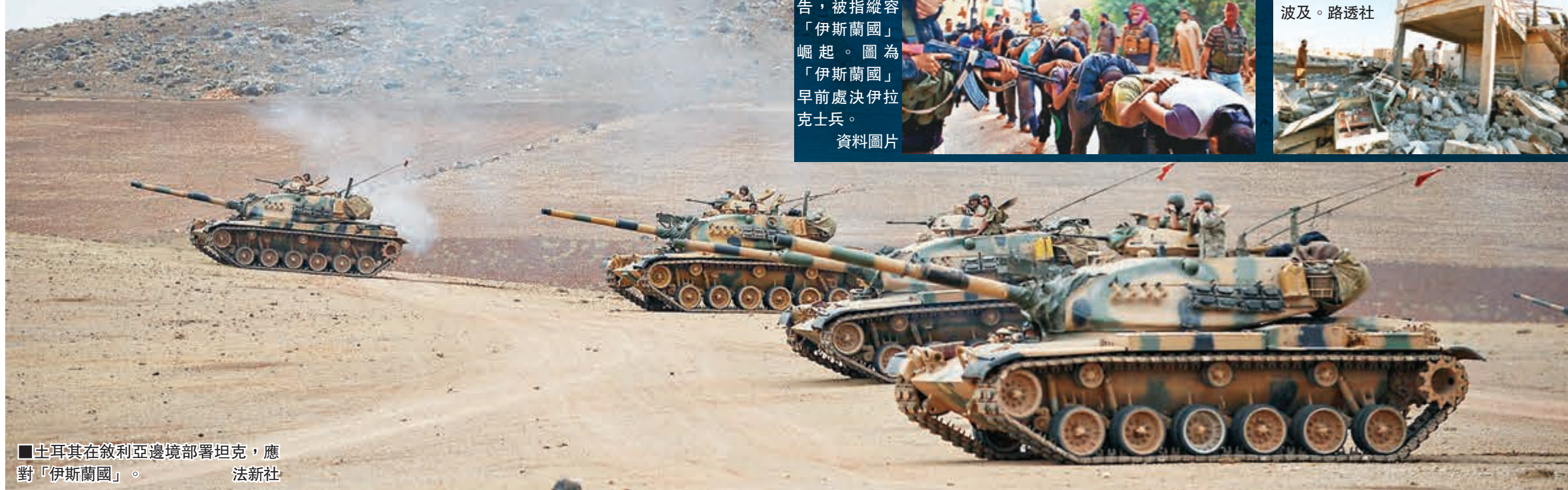
土耳其在敘利亞邊境部署坦克，應對「伊斯蘭國」。法新社

岡薩雷斯闖入後，最終在白宮俯瞰南草坪的綠廳外被攔截，等同是從北端一直闖到另一端。路透社/法新社