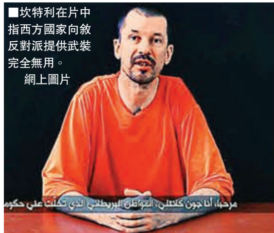
坎特利在片中指西方國家向敘反對派提供武裝完全無用。

美國總統奧巴馬日前在專訪中，指情報機關低估極端組織「伊拉克和黎凡特伊斯蘭國」(ISIL)的勢力，導致他錯判形勢。這番「卸膊」言論隨即惹來共和黨和政策專家狠批，更紛紛揚爆其謊言。有共和黨議員稱，情報官員早在一年前已向奧巴馬發出警告。有知情人士更爆料稱，奧巴馬早在前年總統大選前已掌握準確的情報，知道ISIL正崛起，卻未有應對其威脅。