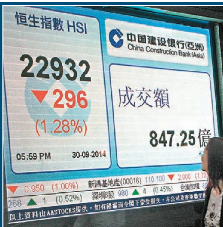
▲港股在國慶前最後一個交易日跌穿二萬三，失守牛熊線水平，昨跌296點。全個9月計，港股大瀉1,810點或7.3%。