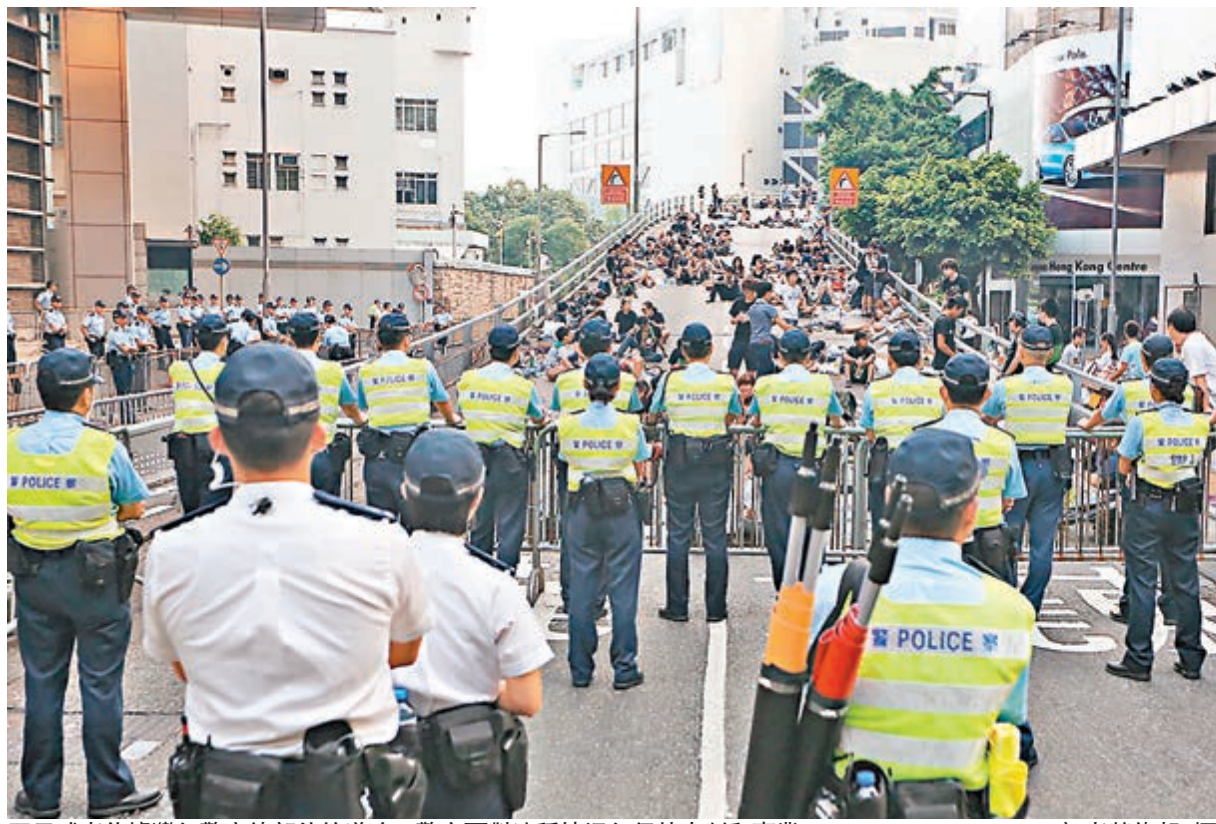
示威者佔據灣仔警察總部外的道路，警方面對這種情況仍保持克制和專業。

韋啟賢於9月28日接受CNBC訪問時解釋警方對「佔中」行動部署。他說，警方至今表現非常克制，坦白而言，警方與示威者表現均非常克制。被問及警方罕有地施放催淚彈，韋啟賢解釋，公眾對催淚彈有錯誤印象，事實上與胡椒噴霧一樣，沒有實質傷害性，也不是暴力打壓甚至暴力逐步升級。被問及警方會否考慮開槍時，他強調即使示威持續擴大，警方只持續增加使用催淚彈。