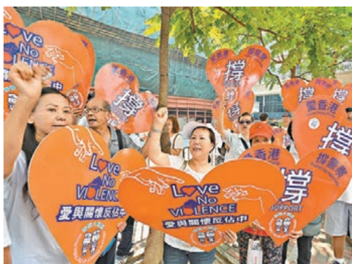
「撐警大聯盟」到警察總部支持警方執法。

教育工作者聯會社區服務處昨日也發起藍絲帶行動，到黃大仙警察總部黃大仙警署外，綁起藍絲帶，向警務人員致敬、慰問辛勞和受傷的警員以及作為特別的迎國慶活動。教聯會呼籲各區家長會和社區組織為警隊打氣，在全港推廣藍絲帶行動，藉以表揚警隊的貢獻。