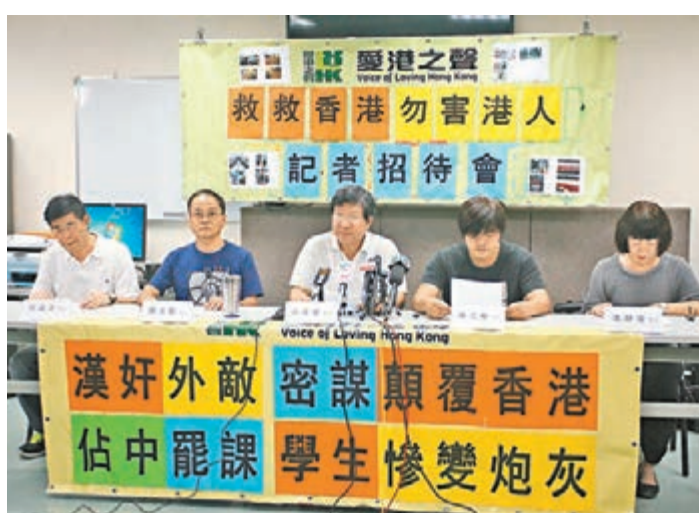
「愛港之聲」記者會發表聲明，指示示威者破壞社會秩序。