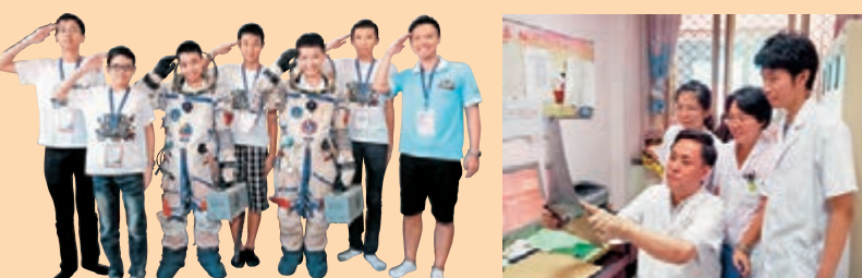
■2009年起獨家贊助少年太空人體驗營，讓本港中學生遠赴北京、西昌及酒泉的國家航天基地，體驗太空人訓練。