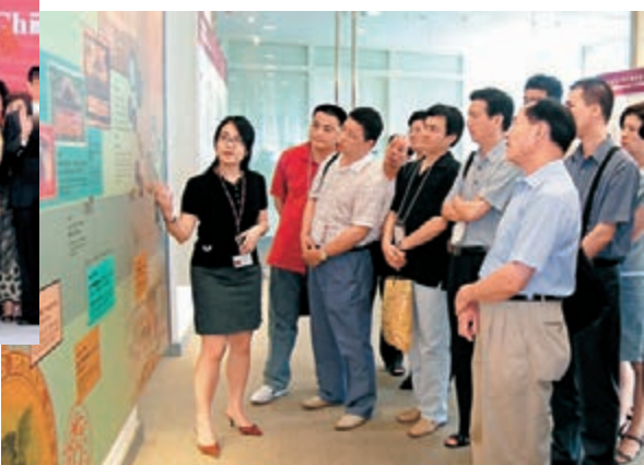
■香港工商業研討班的學員皆學有所成，不少擢升至國家和省部級領導崗位。