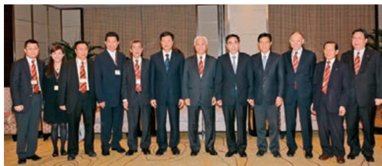
■代表團出席廣交會時與廣東省省長朱小丹（右五）等領導會面。