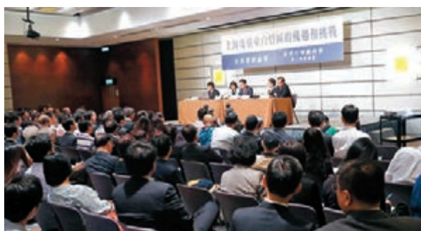
■舉辦「上海及廣東自貿區的機遇和挑戰」研討會，探討相關發展對香港的啟示。