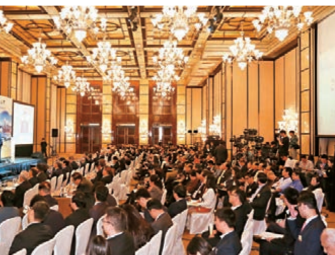
■舉辦「解讀『兩會』論壇」，剖析今年「兩會」的重要報告內容及政策發展方向。