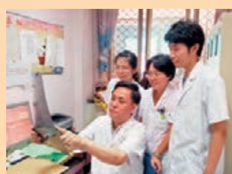
■大學生實習交流計劃每年資助本港大專生到內地不同城市考察實習，了解內地生活文化。