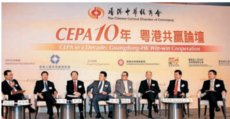
■「CEPA十年·粵港共贏」論壇回顧CEPA十年成果及探討未來發展方向。