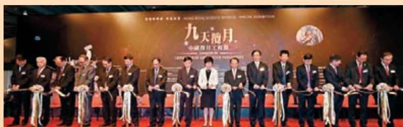
■今年適值中國探月工程立項10周年，特區政府民政事務局與國家航天局合辦「九天攬月—中國探月工程展」，本會為展覽贊助機構之一。