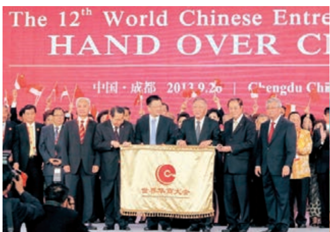
■去年組織代表團赴成都參與世界華商大會，與各地華商交流。