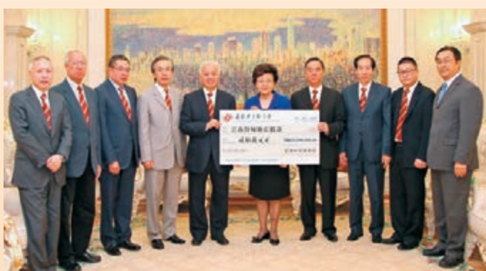
■每當祖國發生重大自然災害，中總必定義不容辭，伸出援手。圖為今年8月向雲南魯甸地震受災同胞捐款。