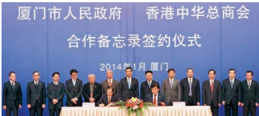
■與廈門市簽署合作備忘錄，建立雙方信息交流平台，加強各方面合作。