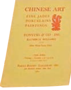
■刊有「瓷母」的1964年拍賣圖錄。

有專業人士研究認為，「瓷母」包含歷來十五種施釉方法、十六層紋飾，青花與仿官釉、仿汝釉、仿哥釉、窯變釉、粉青釉、祭藍釉等均屬於高溫釉彩，需先多翻高溫焙燒；而洋彩、金彩及松石綠釉等屬於低溫釉彩，應後反覆入低溫炭爐焙燒。推斷這「瓷母」大樽集十多種高低溫釉、彩於一身，而且各種釉、彩均發色純正，燒造時必然高溫低溫