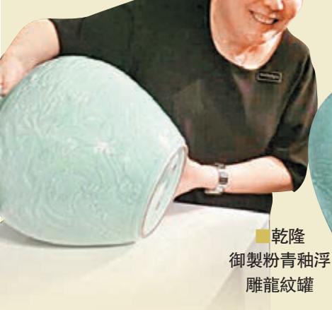
■乾隆御製粉青釉浮雕龍紋罐

蘇富比亞洲區今年上半年拍賣成交強勁，拍賣總成交額高達38億2千萬（港元下同），較去年同期增長近50%，冠絕亞洲區其他國際拍賣行。今年秋季拍賣將於下月4日至8日在港島會議展覽中心舉行，其中重要中國瓷器及工藝品拍賣壓軸於8日舉行。蘇富比精心搜羅一系列來自私人收藏之珍品，聚寶萃珍。