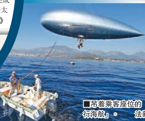
■吊着乘客座位的「飛行海航」。

各界積極研究環保能源，法國發明家魯松就研究出全風力驅動的海上交通工具「飛行海航」，以一艘銀色充氣飛船吊着乘客座位，在海面上空航行。魯松計劃從尼斯出發試飛，越過地中海，於下月底飛抵科西嘉島卡爾維鎮，目前正在法國東南部測試。