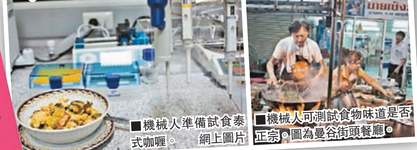
■機械人準備試食泰式咖喱。網上圖片