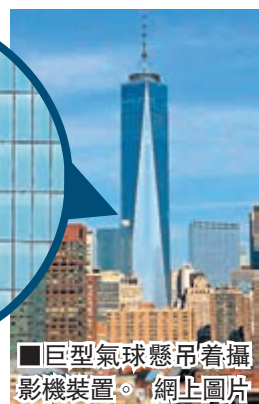
■巨型氣球懸吊着攝影機裝置。網上圖片