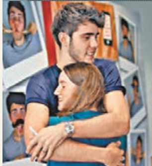
■阿爾菲在新書簽名會擁抱女粉絲。

互聯網資訊包羅萬有，使得被譽為「互聯網世代」的新一代每日花費大量時間上網。這種新的「網絡生活」，造就了一班在網上分享瑣事的博客或視頻博客(vlogger)崛起。來自英國布賴頓的20歲網絡紅人阿爾菲，藉着在影音分享網站YouTube分享日常生活瑣事而打響名堂，進一步在現實世界出書賺錢。