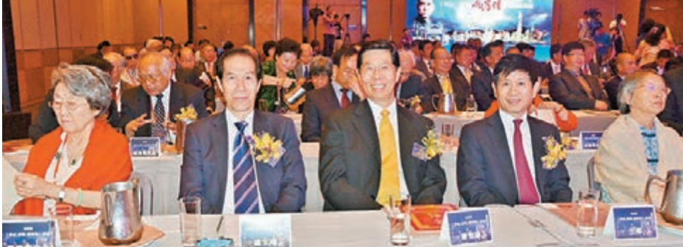
有「唐高人」雅號的中央駐港聯絡辦副主任胡安中將，上海實業集團董事長王偉、友好協會副會長秘書長盧志勇等與來自兩岸的黃埔將領及名將之後相聚論壇，觀看再現黃埔歷史的視頻。