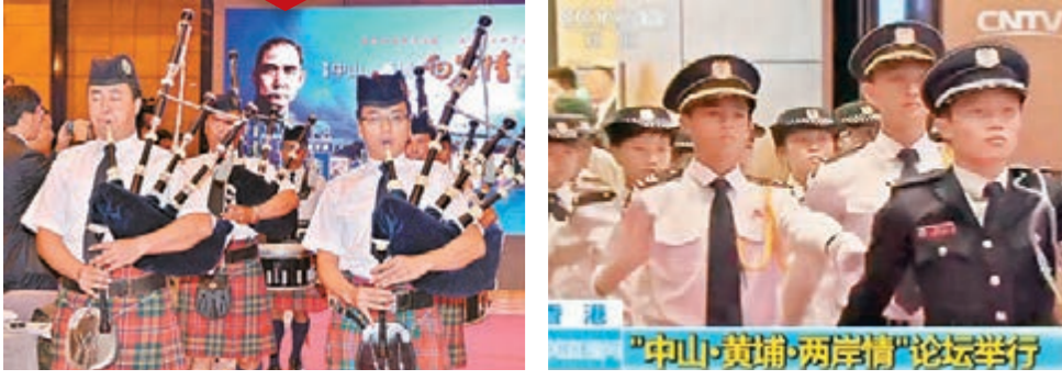
極具香港特色的風笛隊和學生升旗隊以高禮遇歡迎嘉賓，莊嚴、磅礴的氣勢震撼全場。