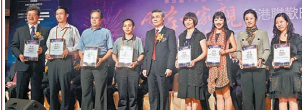
中央駐港聯絡辦副主任黃蘭芳為長期關注「中山·黃埔·兩岸情」論壇的媒體高層頒發貢獻獎。