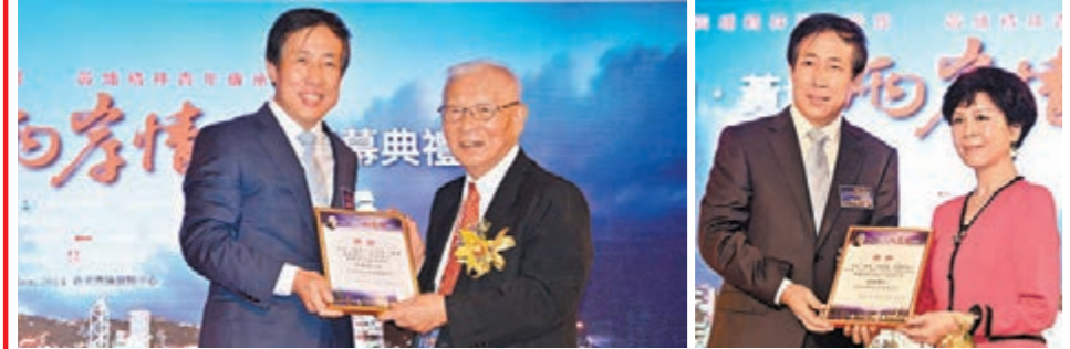
中央人民政府駐港聯絡辦副主任楊建平在開幕典禮上，為「中山·黃埔·兩岸情」論壇創辦及發起人許歷農上將，發起人之一的黃埔將領後代、第五屆論壇籌委會主任、香港大中華會主席、全國政協委員胡葆琳MH頒發「促進兩岸關係和平發展貢獻卓越獎」獎。上海市常委、上海海外聯誼會會長沙海林代表論壇主辦方協辦及資助機構代表頒獎。