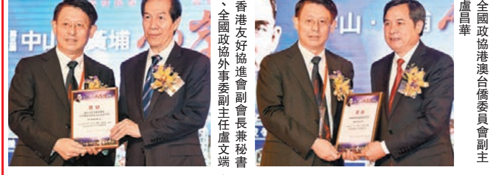
全國政協港澳委員會副主任任國軍。