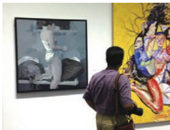
■高水平參展作品令觀展者大呼過癮。