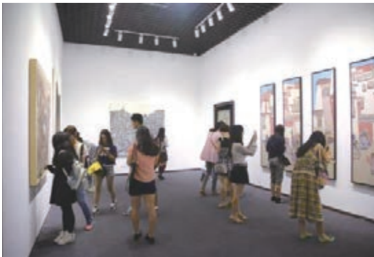
■觀展者中有普通愛好者，也有很多藝術家。