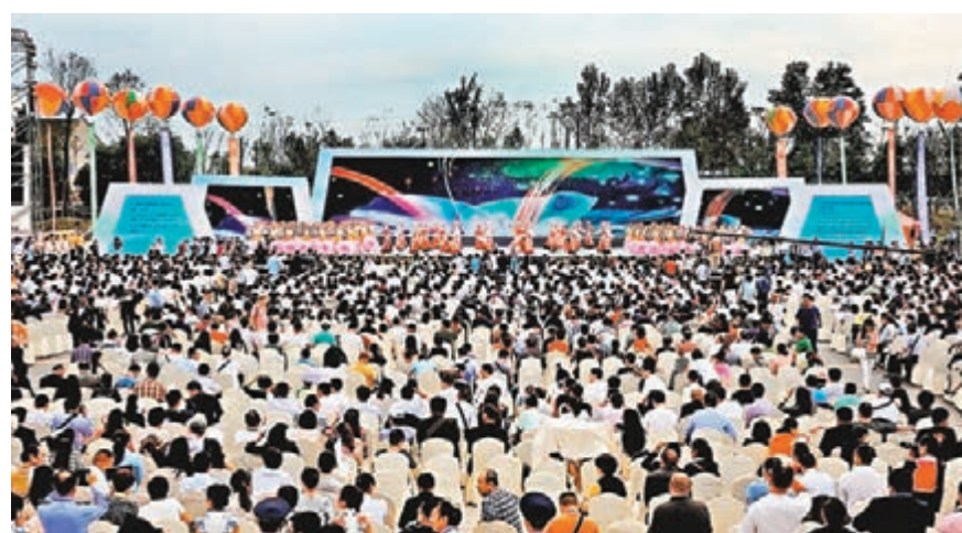
首屆四川國際旅博會日前開幕。

香港文匯報訊(記者李兵四川樂山報道)「十一」黃金周臨近，旅遊再次成為人們關注的焦點。首屆四川國際旅博會場館內，四川智慧旅遊主題區無疑讓四川館裡亮點紛呈。走進4,800平方米的四川館，伴隨着20條精品旅遊線路的推薦展示，21個市州均擁有一個二維碼「名片」。遊客