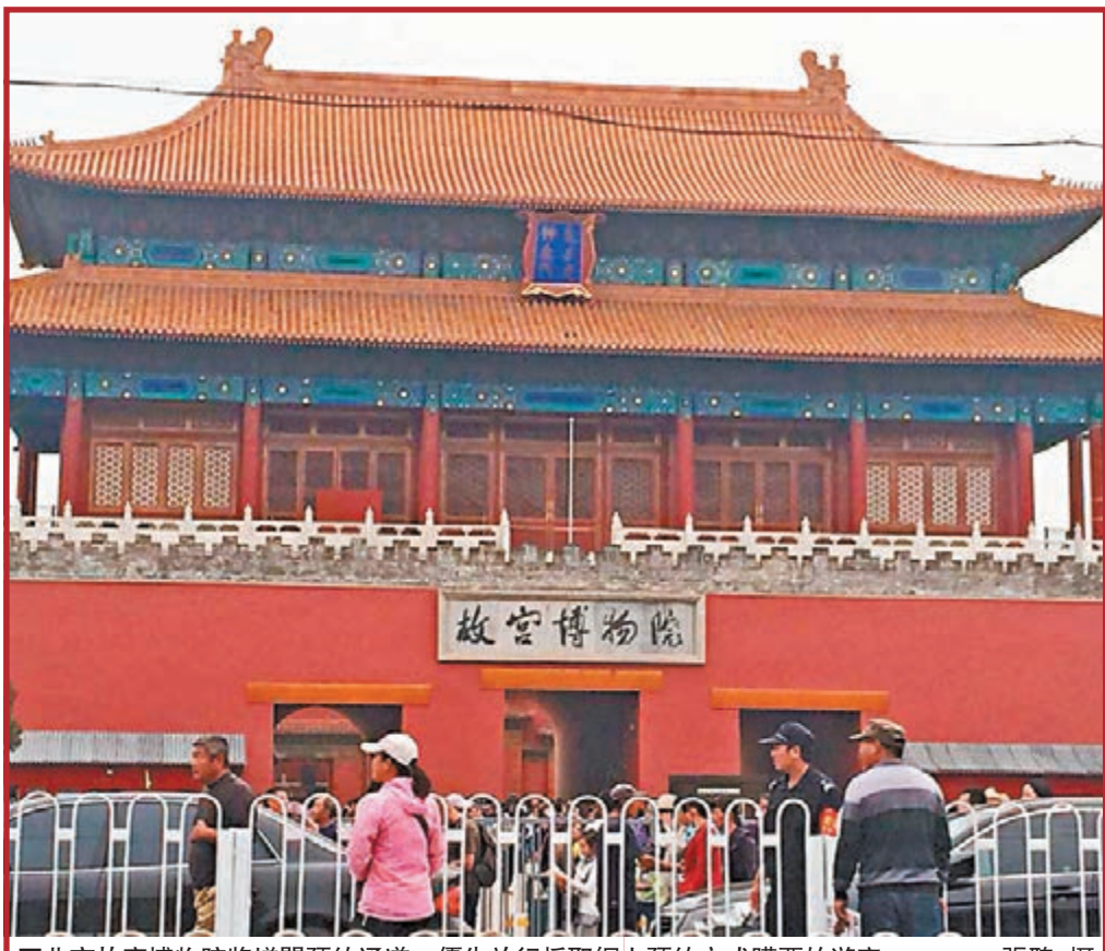
北京故宮博物院將增開預約通道，優先放行採取網上預約方式購票的遊客。

香港文匯報訊(記者馬琳北京報道)隨着「十一」黃金周的臨近，全年旅遊旺季即將到來。旅遊機構預計，今年「十一」期間旅遊市場將接待4.8億人次。大量遊客的集中出行往往導致交通、住宿和景區面臨高強度壓力。部門景區已經表示，今年將結合景區承載量設計售票限額。交通部門則積極調整運力，「十一」期間全國鐵路將加開臨時客車23對，公路通行繼續免費。客流的蜂擁而至，也使熱門地區的酒店、機票供不應求。多家旅行機構表示，今年「十一」期間機票、酒店價格已經普遍漲價三成。