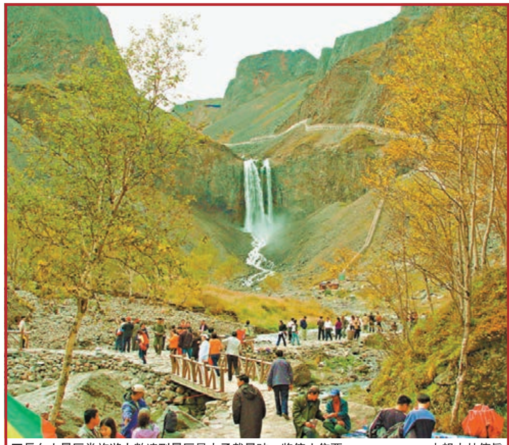
長白山景區當旅遊人數達到景區最大承載量時，將停止售票。 本報吉林傳真

香港文匯報訊(記者馬琳北京報道)隨着「十一」黃金周的臨近，全年旅遊旺季即將到來。旅遊機構預計，今年「十一」期間旅遊市場將接待4.8億人次。大量遊客的集中出行往往導致交通、住宿和景區面臨高強度壓力。部門景區已經表示，今年將結合景區承載量設計售票限額。交通部門則積極調整運力，「十一」期間全國鐵路將加開臨時客車23對，公路通行繼續免費。客流的蜂擁而至，也使熱門地區的酒店、機票供不應求。多家旅行機構表示，今年「十一」期間機票、酒店價格已經普遍漲價三成。