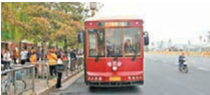
北京旅遊鑼鑼車開通。