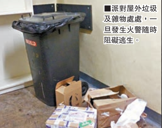
■派對屋外垃圾及雜物處處，一旦發生火警隨時阻礙逃生。