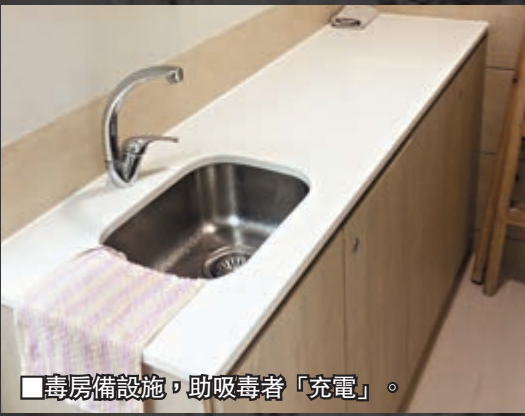
■毒房備設施，助吸毒者「充電」。

■有社工透露，部分工廈空間被改為多個獨立房，一般用作儲物用，但不法分子會將儲物房當作吸毒小房，靜悄悄在房內「充電」。