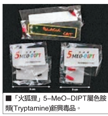
■「火狐狸」5-MeO-DIPT屬色胺類(Tryptamine)新興毒品。