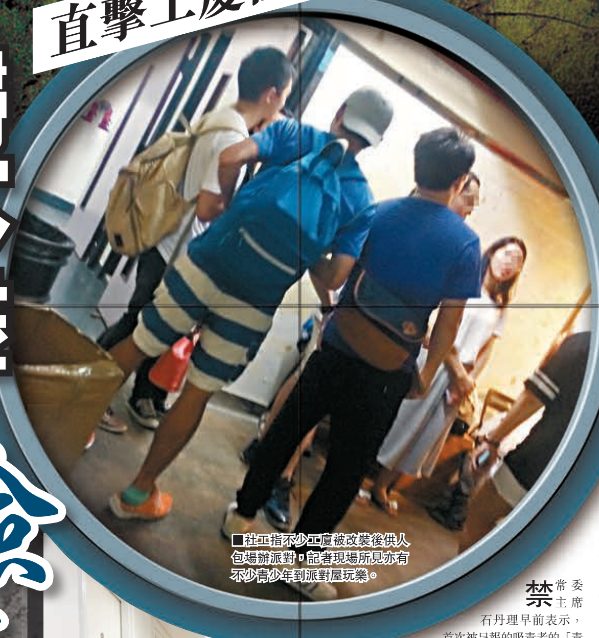
■社工指不少工廈被改裝後供人包場辦派對，記者現場所見亦有不少青少年到派對屋玩樂。