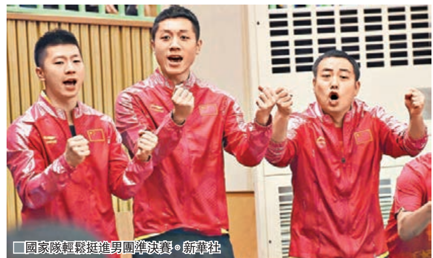
國家隊輕鬆挺進男團準決賽。

香港文匯報訊(記者蔡明亮)香港乒乓球男、女子隊昨日在團體賽8強雙雙失利，男隊與中華台北激戰逾3小時，最終以2:3的總盤數飲恨，而女隊在8強則以總盤數1:3不敵日本，一同無緣晉級準決賽，未能衝擊獎牌。