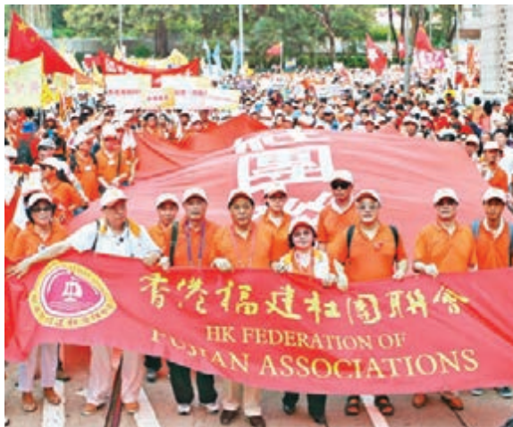
■香港福建社團聯合會手持「依法普選 決不動搖」橫額遊行。

香港文匯報訊（記者 鄭治祖）對於一小撮反對派不顧香港社會強烈反對，發動「佔中」行動，並用武力衝擊警方防線，本港多個社團昨日紛紛予以強烈譴責。香港廣東社團總會、香港福建社團聯合會及九龍社團聯合會指出，堅決支持特區政府和行政長官依法施政，反對任何暴力行為，支持警方嚴正執法。