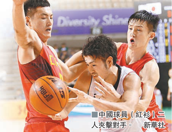
■中國球員(紅衫)二人夾擊對手。新華社