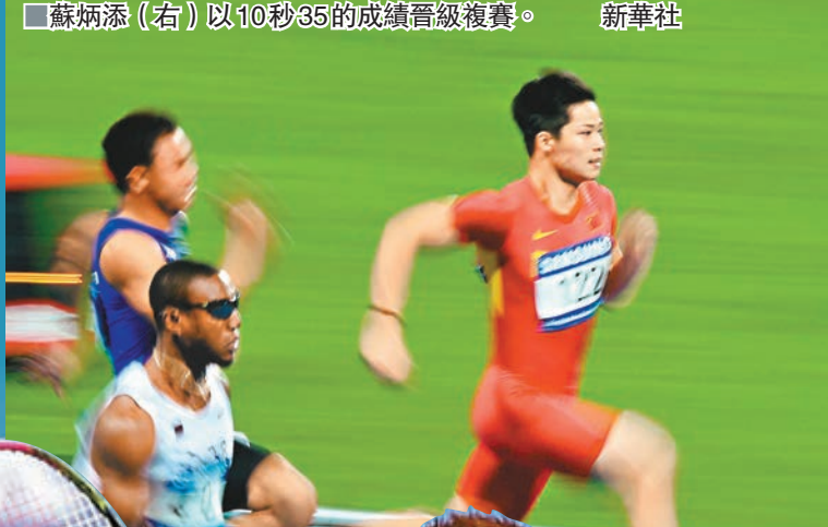
■蘇炳添(右)以10秒35的成績晉級複賽。