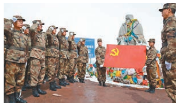
汽車團官兵在唐古拉山口前舉行入黨宣誓儀式。

13點30分，車隊駛出唐古拉山兵站，朝着海拔5,231米的唐古拉山口挺進。數日來，不斷面對高海拔挑戰，遭遇嚴寒與缺氧，記者們已經苦不堪言。然而對於某汽車團三營的部分官兵而言，當天卻是個重要而神聖的日