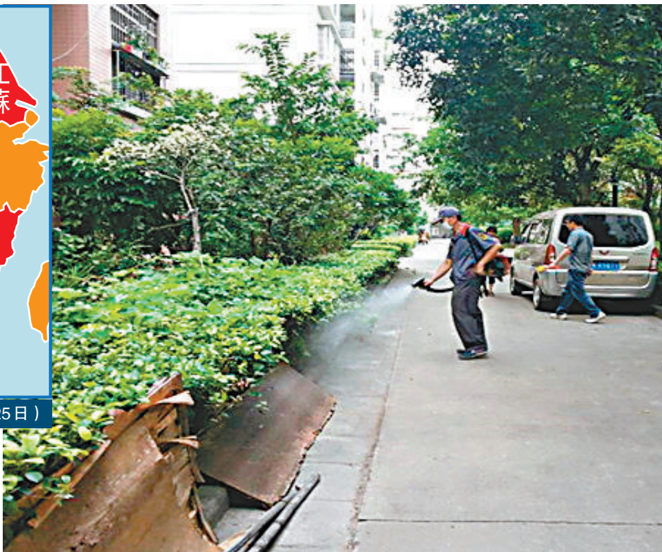
廣東多地市展開統一滅蚊行動。