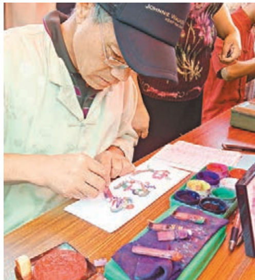
復旦大學舉辦「孔子學院日」活動，展示在中國民間流傳久遠的藝術形式——龍鳳字。記者 章蕪蘭 攝

國務院副總理劉延東昨日在「孔子學院日」啟動儀式上宣讀了習近平、李克強的賀信並致辭。目前全球123個國家和地區已建立465所孔子學院和713個中小學孔子課堂。2013年12月，全球孔子學院大會代表一致通過，決定於今年9月27日舉辦首個全球「孔子學院日」。