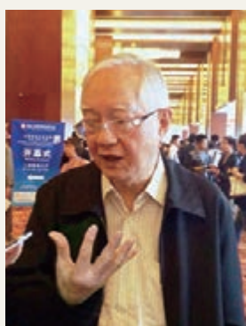
■著名經濟學家吳敬琏接受本報記者採訪

據悉，本次論壇由國家科技部、中國科學院、中國工程院、國家知識產權局、北京市人民政府5家單位共同主辦，中關村科技園區管委會等單位承辦。(北京報道)