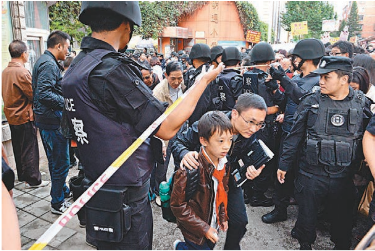
■昆明市明通小學發生踩踏事件,警方封鎖現場。圖為家長接孩子回家。

明通小學創建於1955年,是教育部首批命名的「現代教育技術實驗學校」,是「雲南省一級示範學校」、「雲南省實驗學校」、「雲南省優級甲等學校」。現有43個教學班,2,710名學生。