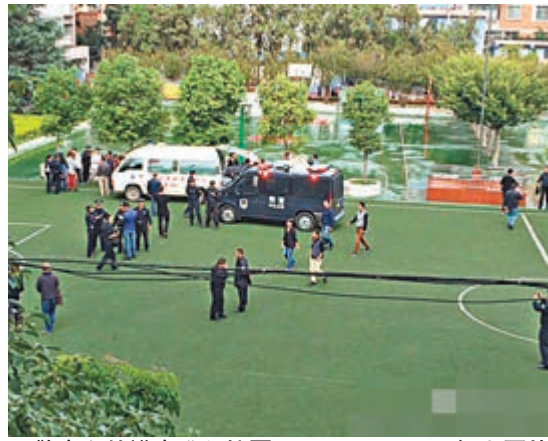
■警車和救護車進入校園。