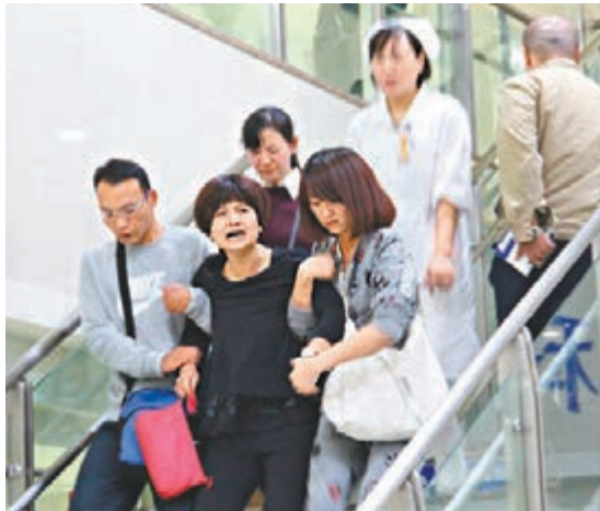
■一位受傷學生的母親在紅會醫院崩潰大哭。