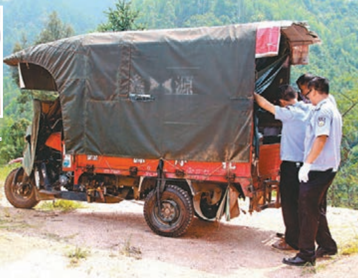
■嫌犯的三輪車在山邊被找到,車上發現一具男童屍體。