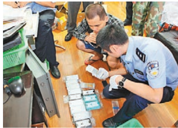
海關查獲的手機及犯罪嫌疑人。

香港文匯報訊(記者 李薇 深圳報導)深圳海關本月 25 日凌晨開展代號「LS14」大規模打擊走私行動，在深圳、廣州、上海、中山等多地，成功摧毀一個走私電子產品網絡，一次性打掉走私電子產品團伙 8 個，案值近 2 億元，涉嫌偷逃國家稅款約 3000 萬元，其中部分走私商品為剛上市的 iPhone 6 及 iPhone 6 Plus。行動中抓獲 28 人包括 8 名港人。