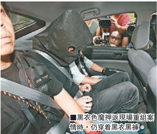
黑衣色魔押返現場重組案情時，仍穿着黑衣黑褲。

至昨午 4 時許，探員將疑人押返麻笏圍現場重組案情，他仍身穿黑衫黑褲，身材瘦削，被黑布蒙