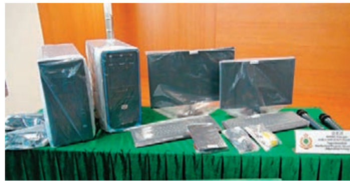
海關在捕獲嫌疑人單位內檢走 2 部載有大量日劇、韓劇及漫畫等檔案的電腦。

香港文匯報訊(記者 杜法祖)海關最近利用與香港大學共同研發的「網線新一代」監察侵權物品系統，首次破獲一宗涉及網上侵權案，並於前日在朗朗拘捕一名男子。該男子涉嫌在互聯網上載逾一萬套侵權作品供人下載，再藉點擊率賺取金錢回報。被捕男子 40 歲，報稱無業，現正保釋候查。