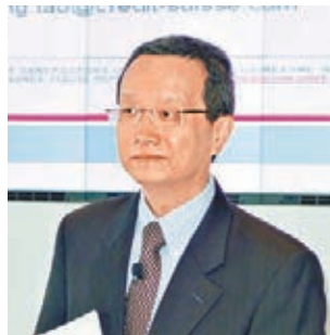
陶冬稱,「滬港通」是兩地散戶10年來最大的利好消息。