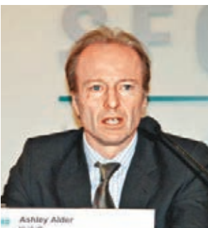
歐達禮獲再度委任為證監會主席唐嘉成昨表示,很高興歐達禮獲再度委任。歐達禮在過去3年致力確保證監會維護香港市場的廉潔穩健,及保持證監會作為世界級金融監管機構的聲譽,貢獻良多。

唐嘉成稱,面對瞬息萬變的監管環境,他對於歐達禮在未來3年繼續領導證監會感到欣喜,並期待在歐的新任期內與其緊密合作。