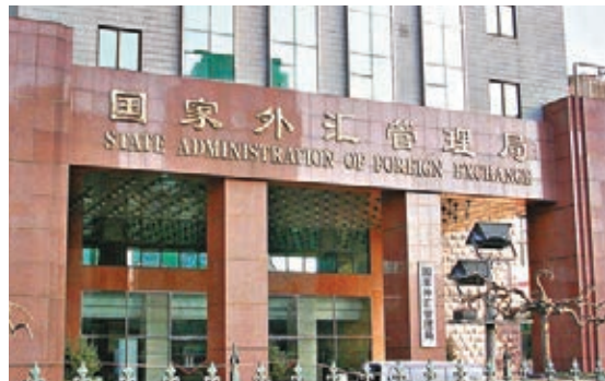
國家外管局表示,香港地區RQFII剩餘額度有限,目前正與其他部門合作研究擴大額度。

香港文匯報訊(記者 海巖 北京報道)國家外匯管理局資本項目司司長郭松25日在北京表示,截至2014年8月末,香港地區2,700億人民幣RQFII總額度已經分配出去了2,653億,剩餘額度有限,目前正與其他部門合作研究擴大額度。