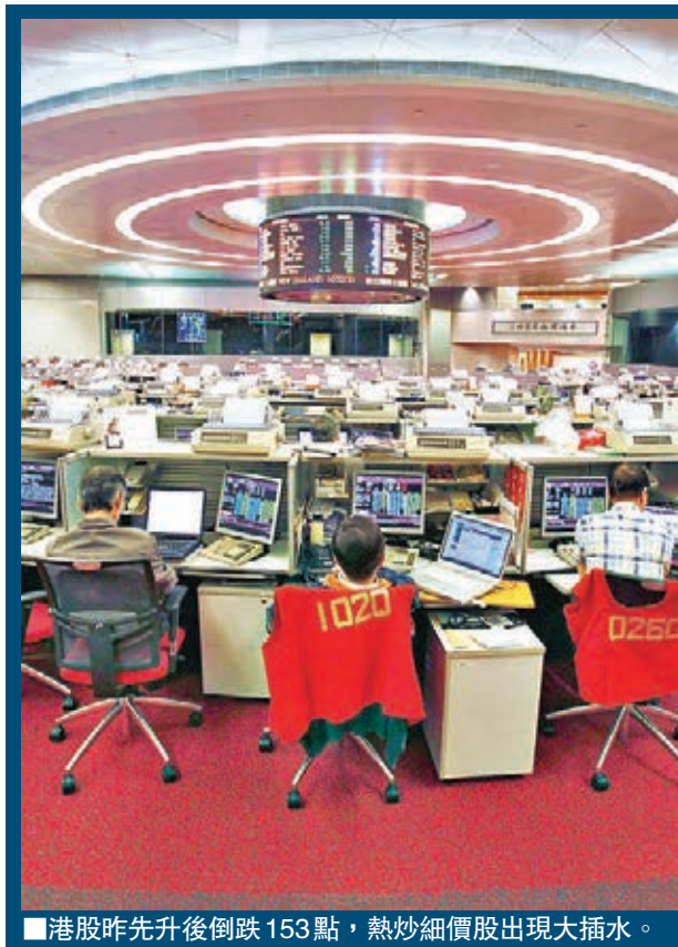
港股昨先升後倒跌153點,熱炒細價股出現大抽水。