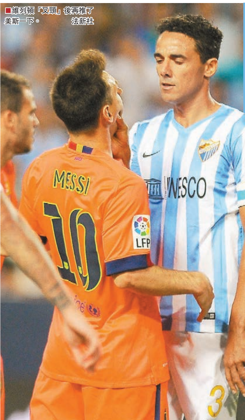
維列頓「叉頸」後再推了美斯一下。