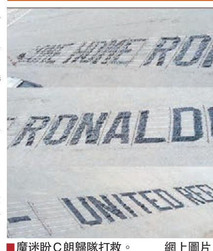
魔迷盼C朗歸隊打救。 網上圖片