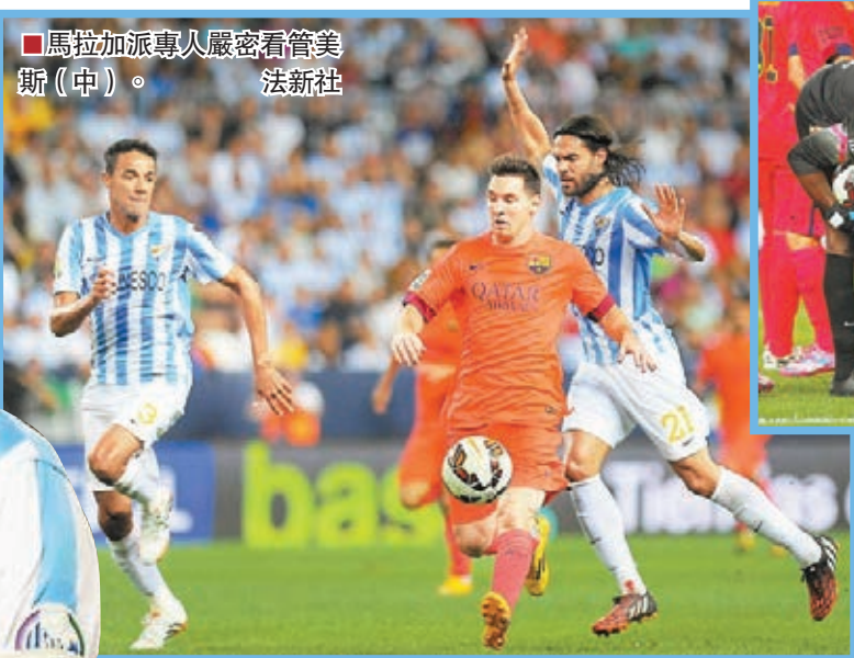
馬拉加派專人嚴密看管美斯(中)。