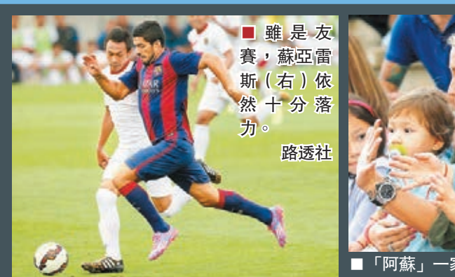
雖是友賽，蘇亞雷斯(右)依然十分落力。