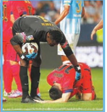
美斯被推跌倒地，對方門將上前慰問。