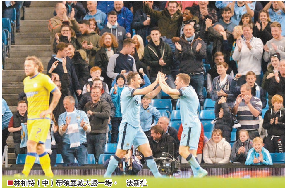
林柏特(中)帶領曼城大勝一場。