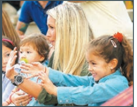
「阿蘇」一家到場打氣。