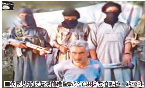
法國人質被處決前遭聖戰分子用槍威迫跪地。