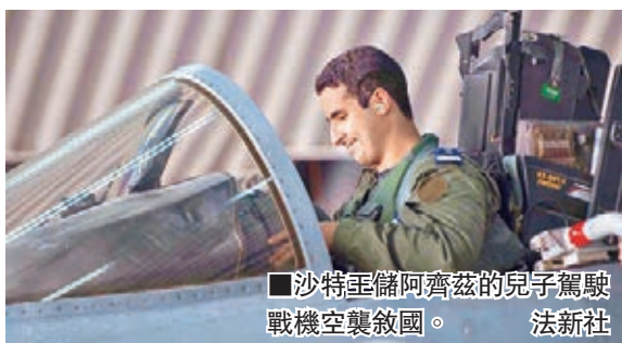
沙特王儲阿齊茲的兒子駕駛戰機空襲敘國。法新社