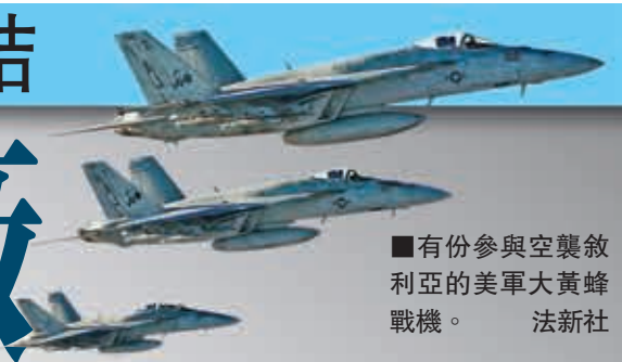
有份參與空襲敘利亞的美軍大黃蜂戰機。