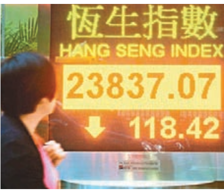
■ 港股昨跌0.49%，成交715.62億元。

思捷業績表現比市場預期優勝。摩根士丹利發表研究報告指，全年度業績較預期好，惟收入則較為遜色，預期本財政年度的盈利與去年相若，遠低於市場預測的9.3億元，且集團轉型需時，復甦速度緩慢，因此維持思捷「減持」評級，目標價11元。而德銀指，該集團全年度純利較市場優於市場預計的1.51億元，營業額符合預期。