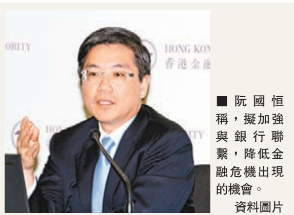
阮國恒稱，擬加強與銀行聯繫，降低金融危機出現的機會。