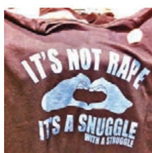
T恤印着「這不是強姦，只是靠在一起時有點掙扎」。