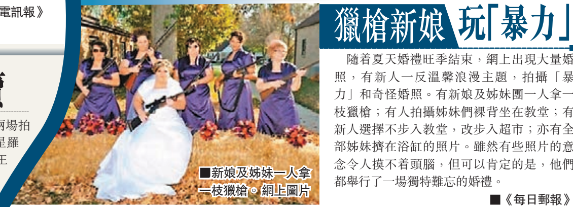
新娘及姊妹一人拿一枝獵槍。