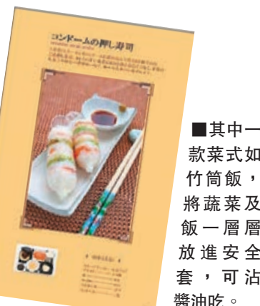
其中一款菜式如竹筒飯，將蔬菜及飯一層層放進安全套，可沾醬油吃。