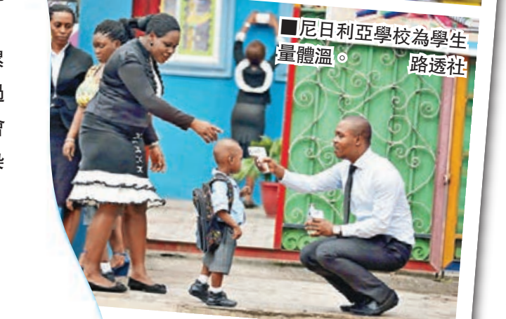
尼日利亞學校為學生量體溫。