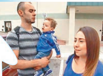
有父母帶嬰兒到醫院檢查。網上圖片

美國得州一間醫院的育嬰室女護士上月25日確診患肺結核，她曾照顧逾700名初生嬰兒。當局上周四向嬰兒的家長發通知書，讓他們帶子女到醫院照肺檢查。肺結核傳染性高，對免疫系統較弱的初生嬰兒尤其危險，治療不當可致命。該女護士任職埃爾帕索的普羅維登斯紀念醫院，當局估計她去年9月已患病，直至上月測試呈陽性反應。700名嬰兒及40名醫院員工有可能被傳染，相關醫護人員已接受檢查，未有證實感染個案，而該女護士於確診後已休假。肺結核病徵包括咳嗽、濃痰、發燒及呼吸短促等，潛伏期達數月至數年。