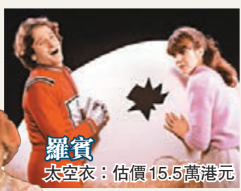
羅賓太空衣：估價15.5萬港元

美國西岸年底將舉行兩場拍賣會，公開拍賣已故影星羅賓威廉斯和英國已故王妃戴安娜的遺物。上月自殺的羅賓於喜劇《Mork and Mindy》中常穿的紅色太空衣及「蛋飛船」，10月將於荷里活收藏品拍賣會亮相，估計太空衣成交價介乎1.5萬至2萬美元(約11.6萬至15.5萬港元)；「蛋飛船」介乎4,000至6,000美元(約3.1萬至4.7萬港元)。比華利山於12月的拍賣會，則將拍賣4條戴妃穿過的長裙，每條估價6萬至10萬美元(約46.5萬至77.5萬港元)。會上還將拍賣其他戴妃及王室的物品，包括她的親筆信及其兒子威廉王子2011年的婚禮邀請函等。