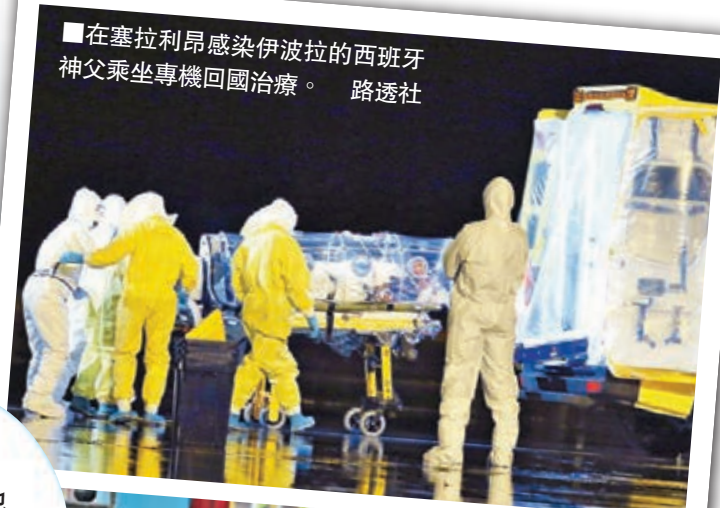
在塞拉利昂感染伊波拉的西班牙神父乘坐專機回國治療。