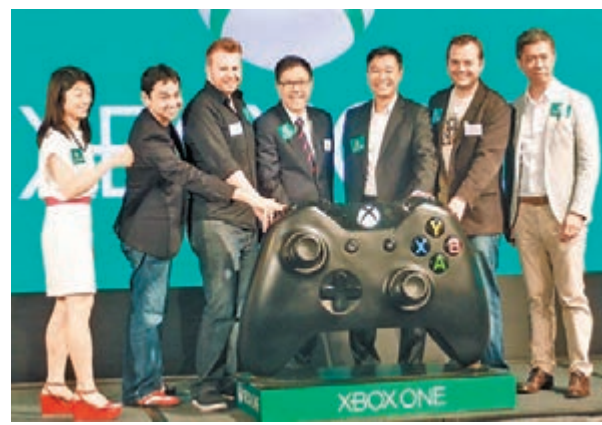
Xbox One今日正式「登陸」香港。

香港文匯報訊(記者 梁偉聰) 微軟香港昨日為一眾機迷及電視迷傳來福音,微軟最新家庭遊戲機Xbox one終於登陸香港,微軟香港更聯同TVB攜手在建立專屬的MyTV程式,Xbox今後除了可以「打機」外,更可以「煲劇」。