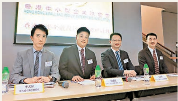
香港中小企前海機遇研討會。

香港文匯報訊(記者 曾敏儀) 前海港深現代服務區早前被質疑偏愛大型企業,該區管理局投資推廣處處長戎衛華昨日在研討會上澄清,前海十分歡迎港資中小企加入,期望可扶植中小企業成長,更以「阿里巴巴」作例子說明每一間大公司都是由小公司發展過來。他又稱,現時前海入區企業達1.3萬家,但港資公司只佔600家,該局有意吸納更多中小企進駐。