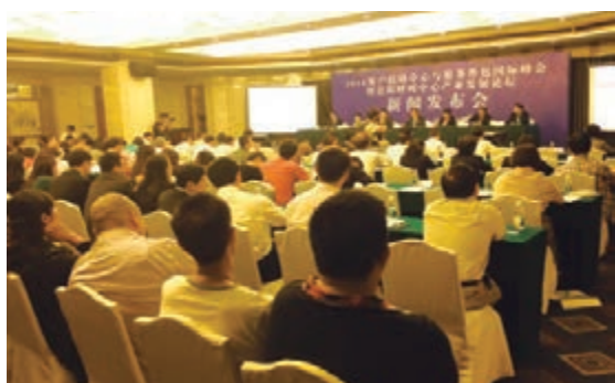
「2014客戶聯絡中心與服務外包國際峰會暨貴陽呼叫中心產業發展論壇」新聞發佈會現場。