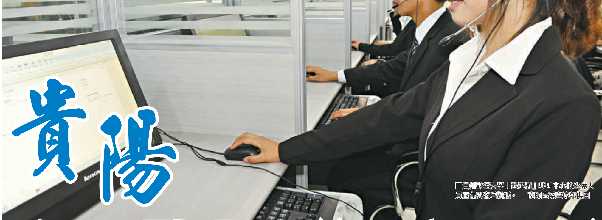
貴州財經大學「世界樹」呼叫中心的坐席人員正在與客戶對話。