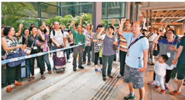
■旅客抵達啟德郵輪碼頭後，一度拒離去。

叫「要求交代」等口號抗議，逗留約6小時後，至下午1時才陸續散去，但聲音會繼續向立法會議員、旅遊業議會及消委會投訴。