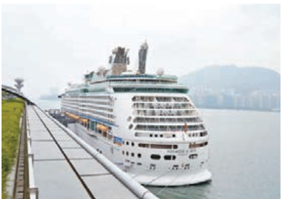
■郵輪「海洋航行者號」。

香港文匯報訊(記者 劉友光、杜法祖)近百名本港郵輪旅客不滿郵輪臨時取消前往日本沖繩的行程，折返台灣時又在海上兜圈多時，經多番交涉後，始獲賠償限制條款多多的每個客艙200美元優惠券，認為得物無所用之餘，更有被愚弄的感覺。因此，各人昨晨隨船返港，並在啟德郵輪碼頭登岸後，一度鼓譟，拒絕離開，大叫口號抗議近6小時始散去，並揚言會向立法會議員及旅遊業議會求助。郵輪公司回應指，受颱風影響，為乘客安全才更改行程，承諾會退還沖繩港口費及岸上觀光費。