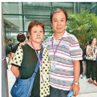
■李氏夫婦乘搭郵輪希望慶祝結婚31周年，不料弄得一肚氣。

「我們很難一同放假，對上一次旅行已是9年前，今次難得可以一同放假旅行，更首次搭乘郵輪，本以為會有一個舒適浪漫的假期，不料弄得極不愉快。」旅客張先生在醫院工作，妻子任職教師，難得一同放假。他指出發前郵輪公司已改變行程，中途又臨時取消沖繩之旅，這都沒問題，但折返台灣時郵輪卻以藉口在海中兜圈兜足一天，令他們有「被搵笨」的感覺。