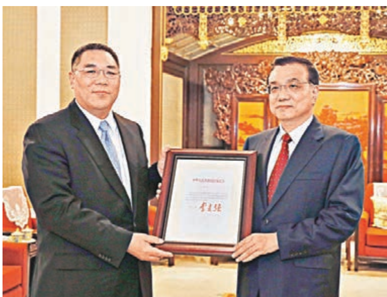
■國務院總理李克強向崔世安(左)頒發國務院令。

崔世安表示祝賀，並對崔世安上一任行政長官任期內的工作給予充分肯定。李克強指出，澳門回歸祖國15年來，「一國兩制」實踐取得巨大成功。這是在中央政府大力支持下，特區政府和澳門社會各界團結奮鬥、拚搏努力的結果。