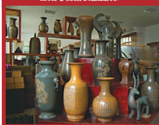
■坭興陶製作及精品展示。

早在兩千多年前的漢代，欽州就是中國通往東南亞的古代海上絲綢之路的始發港之一，一直與東南亞國家保持着密切的友好往來。欽州保留有多處嶺南特色的騎樓和古居群，欽州城區老街上的一馬路至五馬路有上百年的獨具風格的騎樓，成為這裡百姓生活、經商、遊玩的街區。大蘆古村是廣西目前保存最完好的明清民居建築群之一，距今已有約500年歷史。村宅湖畔及四周種植有寓意「文章顯世，紅頂當頭」的古陸樹、樟樹和荔枝樹。楹聯是大蘆古村古宅群文化中的一大特色，目前留存楹聯共350副，為明代創作留存，大蘆村因此被譽為「廣西楹聯第一村」的美稱。