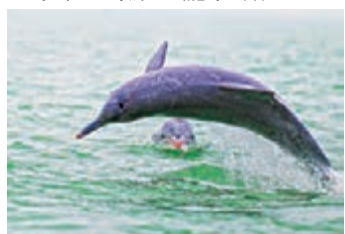
■三娘灣白海豚。