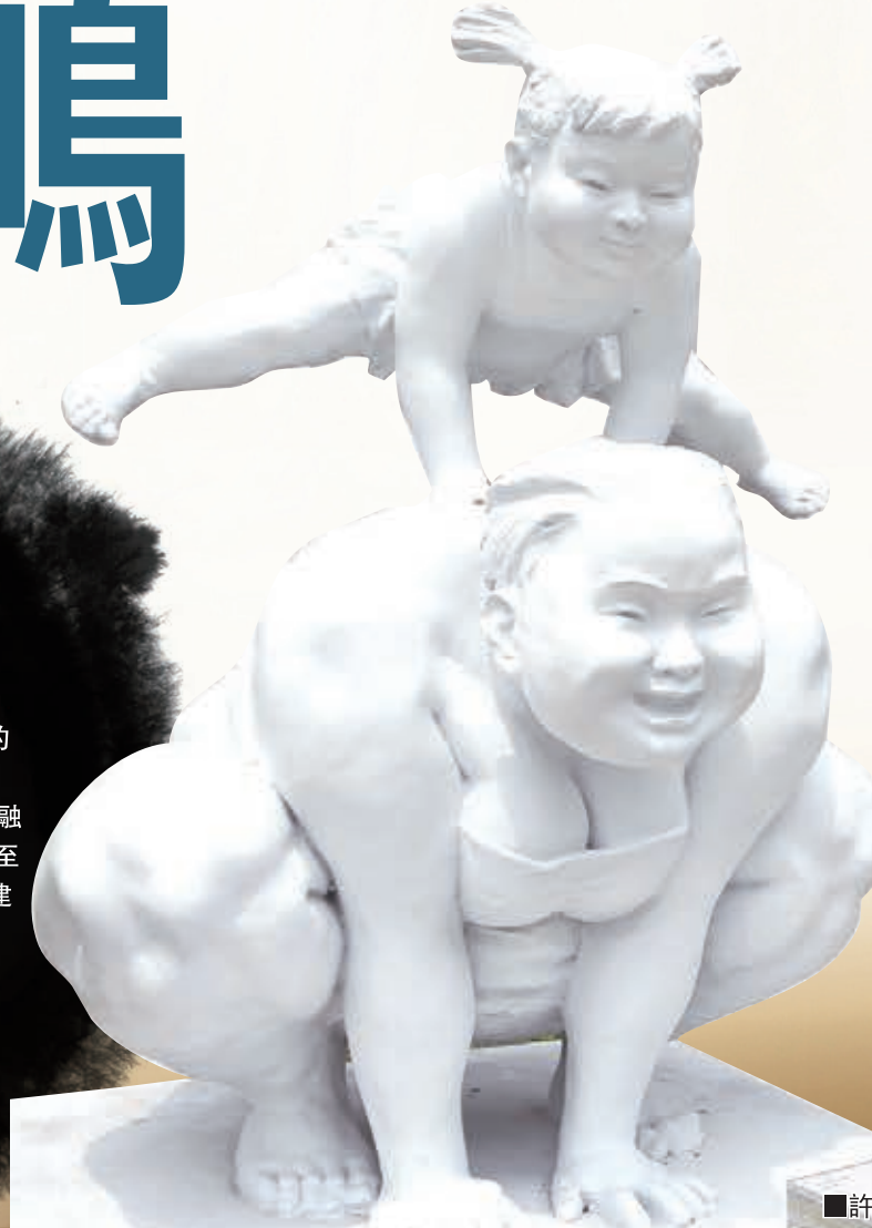
■許鴻飛「肥女」雕塑系列獅城過中秋，受到當地市民的盛讚。