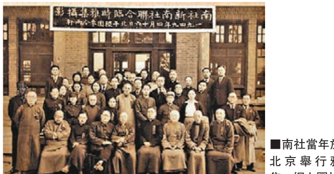
南社當年於北京舉行雅集。