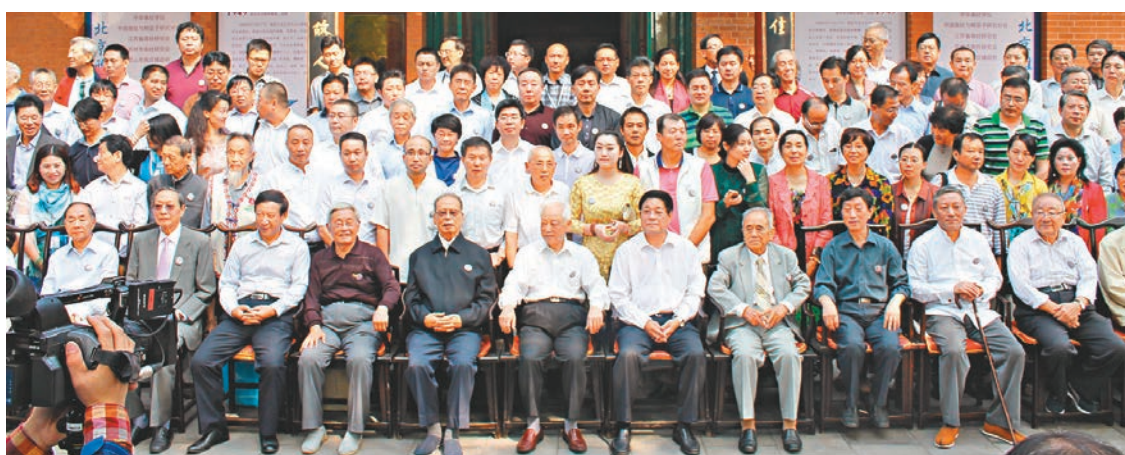
南社研究學者、南社後裔等社會名流合影。

這次雅集活動中,還同時舉辦了系列南社文化的展示活動。有陳去病、柳亞子、黃興、葉楚傖等多位南社先賢的詩文稿或革命檄文原稿的「南社名人手稿真跡展」,「南社名人古籍展」,「建國65年來南社研究成果展覽」,「中國南社文化遺產保護聯盟」;《中華南社文化書系》30部卷新著首發以及《百年南社 南社詩畫》——當代南社書畫巡展」等。