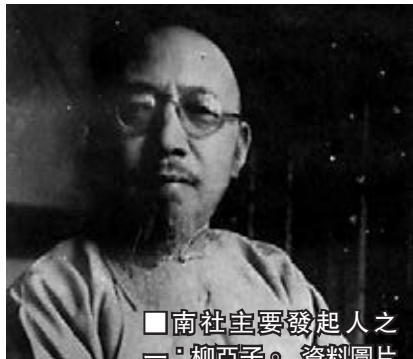
南社主要發起人之一柳亞子。資料圖片