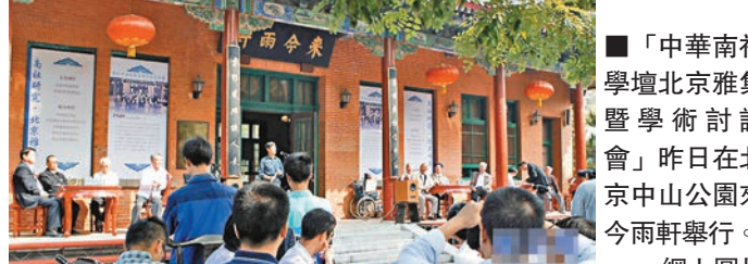
「中華南社學壇北京雅集暨學術討論會」昨日在北京中山公園來今雨軒舉行。