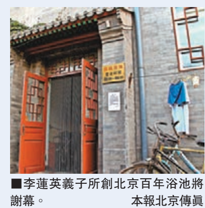
■李蓮英義子所創北京百年浴池將謝幕。

數量案件，也是兩岸共同打擊毒品犯罪史上，查獲毒品數量最多的案件。大陸警方11日起陸續在廣東、江蘇、山東及上海等地搜索及緝捕20多名疑犯，其中3人為台人，搜獲第二級毒品甲卡西酮1040公斤、第四級毒品麻黃素1600公斤等。