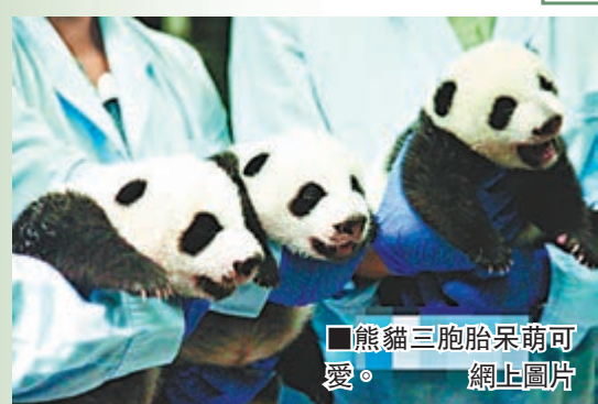
■熊貓三胞胎呆萌可愛。

從廣州長隆野生動物世界獲悉，世界首例三胞胎熊貓寶實已陸續開眼看世界，身體也已長成黑白分明的小圓球。據大熊貓專家介紹，大熊貓寶實一般會在45天以上開眼。長隆的三胞胎大熊貓寶實中，老二最先開眼，其次為老三和老大。「開眼」後，熊貓寶實對外界變得更加敏感，任何外來的刺激都會對牠們造成更大的影響。三隻小寶實的身體圓滾滾，呆萌可愛，體重比滿月時又增加了一倍，三隻熊貓寶實的