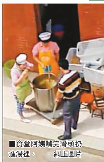
■食堂阿姨啃完骨頭扔進湯裡。

廣州交通技師學校的食堂裡，一位戴綠色圍裙、白色廚師帽的食堂阿姨，從一口湯鍋裡撈出一塊骨頭啃完之後，把吃剩的骨頭又扔回鍋裡；接下來，另兩位員工推着這鍋免費鮮湯就給食堂的師生們送去喝了！這一幕被一個同學用手機全程拍下並發到網上，頓時沸沸揚揚！校方趕緊滅火，表示：這個食堂是外包的，將會停業整頓一天。學校這個回應有點自欺欺人，處理方法也實在讓人費解，師生的身體健康是學校首要保障，推脫責任？實在不是聰明的辦法。■中國之聲