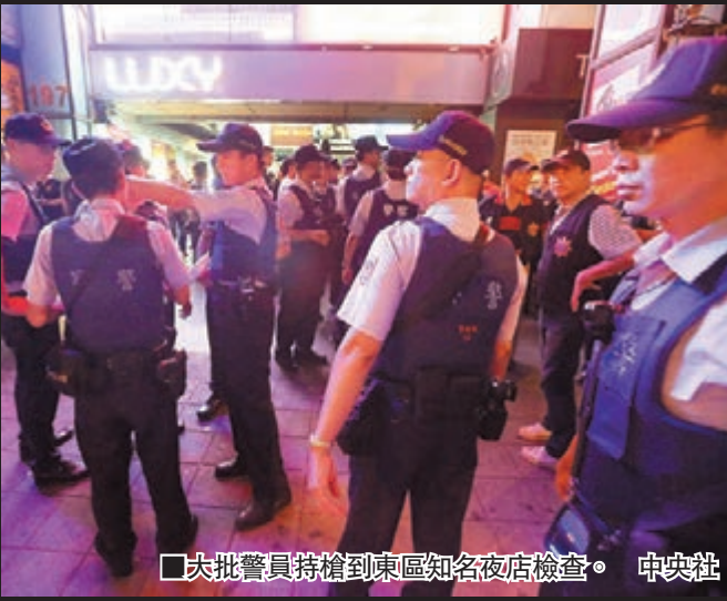
■大批警員持槍到東區知名夜店檢查。