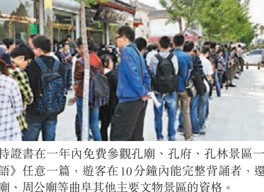
■《論語》背誦廳門口大排長隊，參與者眾。本報山東傳真

孔子故里曲阜推出旅遊新創意，遊客在10分鐘內背誦30條《論語》，便可免費參觀「三孔」景區。活動開展一年多以來，參與者已超過萬人。其中年齡最長者86歲。山東省曲阜市自去年5月1日推出背《論語》免費遊「三孔」活動。按照規定，遊客只要在10分鐘內背誦出30條《論語》，並由評委隨意抽取其中5條能夠正確釋義，背誦應便為其頒發《榮譽證書》，遊客可持證書在一年內免費參觀孔廟、孔府、孔林景區。截至今年8月，活動參與者共計14647人，通過並頒發證書者有9741人，通過率達到67%。青少年和大學生佔到了90%左右，其中不乏外國遊客。年齡最大的參與者86歲，特意從濟南趕到曲阜參加此活動，並能背誦完整的論語。而最小的參與遊客只有4歲。■本報記者 何冉 山東報道