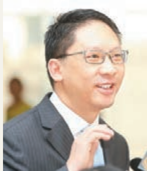
袁國強昨日與南丫海難家屬會面，通知家屬警方已完成刑事調查。資料圖片

香港文匯報訊（記者 文森）律政司司長袁國強昨日與南丫海難家屬會面，通知家屬警方已完成刑事調查，並預計要3個月時間研究相關證據，再決定是否提出檢控。家屬對暫時未有人被檢控感到不滿，但又無可奈何。