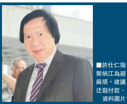
許仕仁指郭炳江為避麻煩，建議迂迴付款。