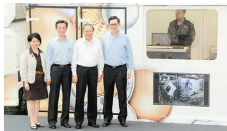
金管局下月6日正式推出硬幣收集計劃，兩輛裝有防彈玻璃的「收銀車」將會在港九新界不同地區向市民收集硬幣。

香港文匯報訊（記者 梁偉聰）市民日常購物時不少不免會收到不少俗稱「神沙」的小額硬幣，雖然這些硬幣與鈔票一樣都是流通的貨幣，卻因質量重、面額細，再加上八達通的流行，「神沙」的使用率愈來愈低。金管局昨日公布，下月6日正式推出硬幣收集計劃，未來兩年，兩輛裝有防彈玻璃的「收銀車」將會在港九新界不同地區輪流服務，向市民收集硬幣。